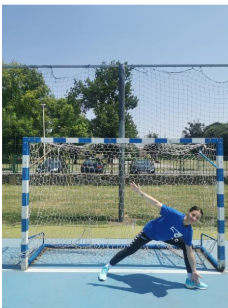
Slika 4. Obrana niskog udarca

Iz osnovnog stava vrši se otklon suprotnom nogom u odnosu na loptu, koji je usmjeren pod što manjim uglom. Noga bliža lopti istovremeno vrši bočni iskorak tako da se težina u potpunosti prenosi na iskoračnu nogu. Trup se otklanja prema mjestu kontakta s loptom uz istovremeno okretanje oko uzdužne osovine prema naprijed. Bliža ruka se ispruža i postavlja ispred iskoračne noge gotovo do tla, dok je slobodna ruka ispružena i nalazi se s druge strane trupa radi održavanja ravnoteže (Slika 4.) (Rogulj, 2000).