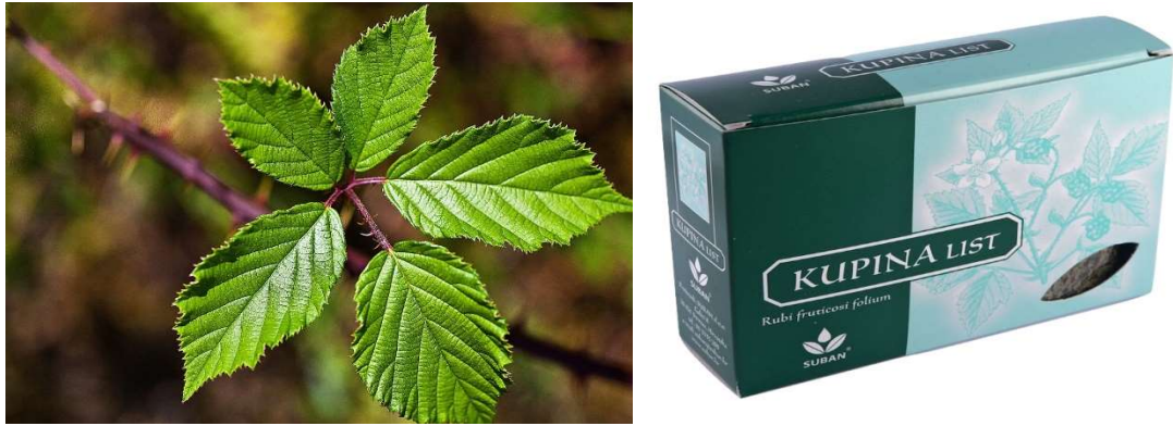
Slika 4. a) List kupine; b) Čaj od lista kupine

Zaboravljeni listovi bobičastog voća dobivaju sve širu primjenu te se mogu promatrati kao izvori vrijednih bioaktivnih spojeva čija svojstva utječu na zdravlje i prevenciju bolesti. (29)