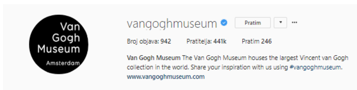
Slika 1. – Primjer opisa koji ispunjava gore navedene karakteristike

Bilo da je riječ o Facebooku, Instagramu ili Twitteru, brendovi često ne obraćaju dovoljno pažnje opisu profila. Kada je institucija u procesu izgradnje brenda, treba jasno dati do znanja kojom djelatnosti se bavi i što pratitelj može očekivati od profila (slika br.1). Idealno bi bilo ubaciti i poziv na akciju u opis, poput hashtaga. Na opis treba gledati kao na “pitch” - zašto bi potencijalni pratitelj i posjetitelji zapratili upravo taj brend. (Jackson 2016)