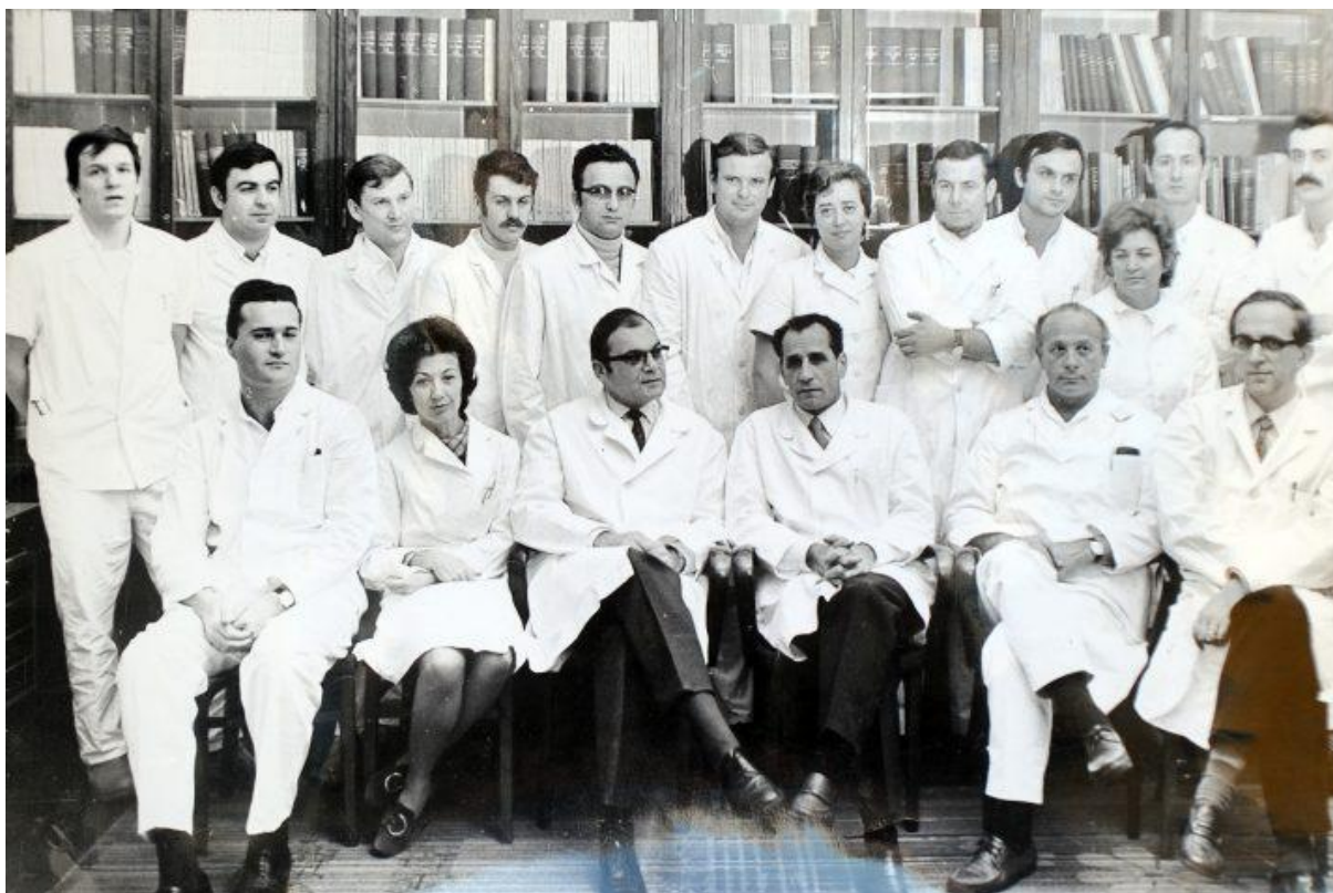
Slika 7. Multidisciplinirani tim na čelu s prof. Vinkom Frančiškovićem koji je sudjelovao u prvoj transplantaciji bubrega u Rijeci.

Učinjene su anastomoze renalne vene termino-lateralno na venu ilijaku eksternu, a renalnu arteriju su anastomozirali na arteriju ilijaku internu. Učinjena je i ureteralna anastomoza uz nefrostomiju i tako se očuvao urinarni put. Vaskularne anastomoze su trajale 43 minute, a bubreg je odmah preuzeo svoju funkciju. Pacijent je odlično podnio zahvat i jako dobro se oporavio te je ubrzo pušten iz bolnice. On je nakon zahvata živio 14,5 godina, a smrt je uzrokovao tumor jetre. Cijelom ovom zahvatu je prethodila dugogodišnja priprema. Naši liječnici su žrtvovali svoje vrijeme i sav svoj napor uložili kako bi bili korak uz korak sa svjetskim liječnicima. Rad francuskih liječnika u području transplantacije nije prošao nezapaženo u svijetu. Zako je 1968. godine doktor Petar Orlić na zamolbu prof. Vinka