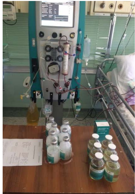
Slika 4. Mobilni stroj za kontinuirano nadomještanje bubrežne funkcije s filterom za PF, proces PF u tijeku.