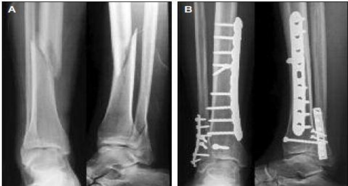
Slika 6.1.1. Primarno cijeljenje prijeloma nakon osteosinteze prijeloma tibie i fibule; preuzeto iz: Medicographia (2014) Osteoporosis: the fracture cascade must be stopped; Vol 36, No. 2, str. 157.

diferenciraju u osteoblaste i oni zatim produciraju lamelarnu kost koja se stvara na površini svake pukotine. Pukotinsko cijeljenje je inicijalni proces kod ovog tipa cijeljenja i traje oko 3-8 tjedana te se na njega nastavlja proces sekundarne remodelacije kosti i kontaktnog cijeljenja prijelomne pukotine (Shapiro F, 1998).