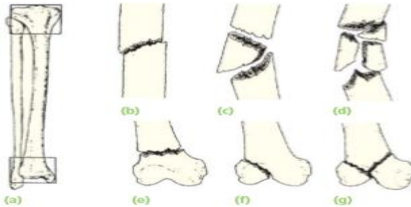
23.3 Müller's classification (a) Each long bone has three segments – proximal, diaphyseal and distal; the proximal and distal segments are each defined by a square based on the widest part of the bone. (b,c,d) Diaphyseal fractures may be simple, wedge or complex. (e,f,g) Proximal and distal fractures may be extra-articular, partial articular or complete articular.

Slika 4.2. Müllerova klasifikacija prijeloma kosti; preuzeto iz: Solomon L et al. (2010), Apley's System of Orthopaedics and Fractures; str. 689.