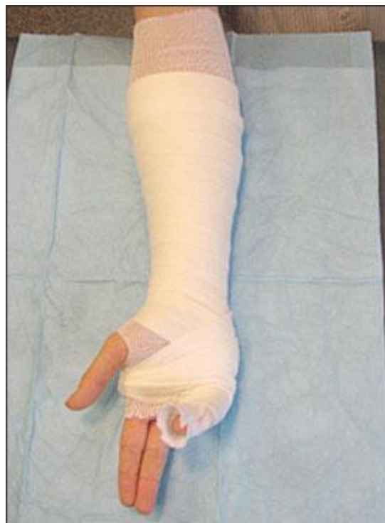
Slika 8.3.2. Sloj vune (padding) koji se oblaže na presvlaku od trikoa, preuzeto iz:

Nadalje slojevi vate stavljaju se na presvlaku od trikoa, kako bi se izbjegla maceracija kože ozlijeđenog uda i kako bi se taj sloj akomodirao na nastanak otekline. Slojevi vate stavljaju se cirkularno na ozlijeđeni ud, od jednog do drugog kraja uda na koji će se postaviti longeta ili cirkularni gips, i to na način da svaki idući sloj prekriva 50% prethodno stavljenog sloja vate. Ta tehnika postavljanja odmah će dati dvostruki sloj vate. Naravno uvijek se mogu dodati dodatni slojevi ukoliko za time postoji potreba. Ako se tehnika pravilno izvodi dobivaju se dva do tri sloja vate, koja bi se trebali protezati 2-3 cm iznad oba kraja longete ili cirkularnog gipsa (Prpić I, 1989).