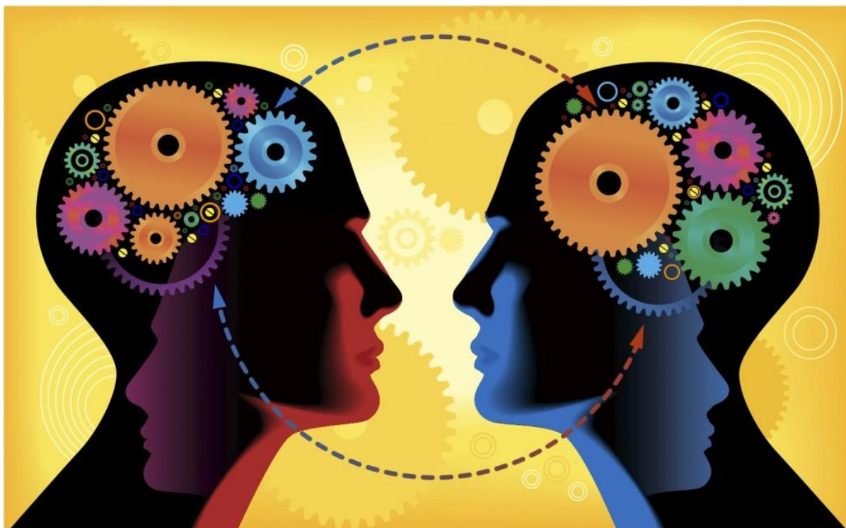
Slika 1. Empatija