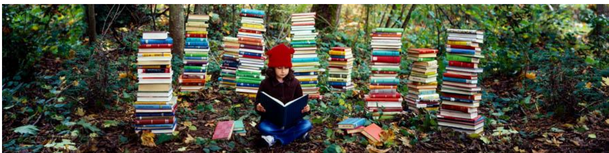
Slika 3. Poticanje kulture čitanja

Za jačanje osjećaja empatije kod djece važno je usvojiti kulturu čitanja. Danas mladi ljudi sve više gube osjećaj razumijevanja za druge, a to je u velikoj mjeri povezano s korištenjem moderne tehnologije i slabljenjem zanimanja za knjige. Čitanjem se obogaćuje naše iskustvo te potiče empatija prema likovima, pa čitači i u svakidašnjem životu imaju više empatije prema drugim osobama i bićima. U kompjuterskoj igri možete spasiti princezu da dospijete na slijedeći nivo, ali ta ista princeza u knjizi ima svoju prošlost, sadašnjost, budućnost i motivaciju i dok zamišljate događaje kroz koje ona prolazi neminovno se povezujete s njenim likom (Alexander i Sandahl, 2016).