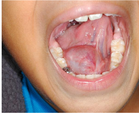
Slika 4. Preoperativni prikaz ranule.[31]

(Preuzeto: https://emedicine.medscape.com/article/847589-overview )