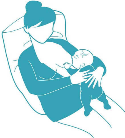
Majka koja doji u ležećem položaju (9)

Dojenje na leđima još se naziva i biološkim dojenjem. U tom položaju majka je na leđima, a dijete na njoj. Svaki dio djetetova tijela okrenut je prema majci i dodiruje je te se naslanja na prirodne krivulje majčina tijela. Ovaj položaj nije isključivo položaj za dojenje udoban za majke. Položaj je dobar kod majki koje se oporavljaju od epiziotomije, majki s manjim grudima te kod majki koje se bore s prejakim refleksom otpuštanja mlijeka. Savjetuje se i kod beba kojima je dijagnosticiran skraćeni frenulum.