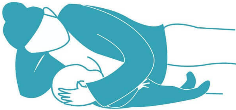
Majka doji dijete u bočno ležećem položaju (9)

Majka leži na boku stranom dojke koja doji, iza leđa se postavi nekoliko jastuka te jedan ispod glave i ramena kako bi leđa i bokovi bili ispravljani u ravnini. Beba je u ovom položaju okrenuta prema majci, gornja majčina ruka drži dlanom bebinu glavu, a donja ruka je ispod majčine glave kako ne bi smetala. Najpovoljniji je položaj u prvim danima nakon poroda i za noćne podoje.