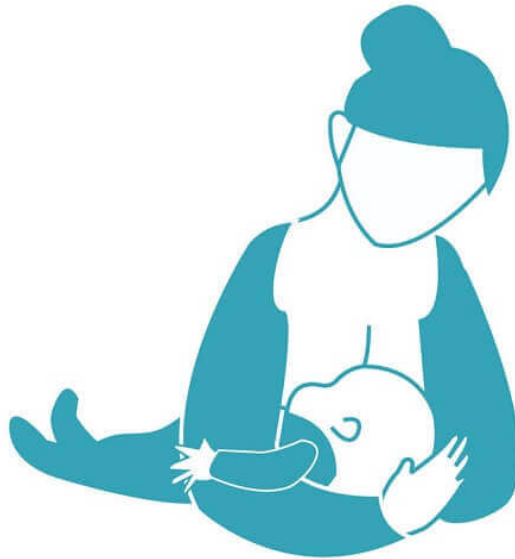
Majka doji dijete u položaju „nogometne lopte“(9)

Dijete se stavlja majci na bok i drži ga se između boka i ruke. U dlanu svoje ruke drži djetetovu glavicu, a leđa podupire podlakticom, noge su usmjerene prema majčinim leđima, a usta djeteta su u visini bradavice. Ispod djeteta se stavi jastuk kako bi dijete bilo u pravoj visini i nosićem moglo dotaknuti bradavicu.