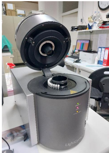
Slika 3. Uređaj LightCycler® 1.2 (Roche Diagnostics Ltd., Švicarska)

Genotipizacija HFE izvođena je pomoću uređaja LightCycler® 1.2 Real time PCR System (Roche Diagnostics Ltd., Švicarska) (Slika 3.).