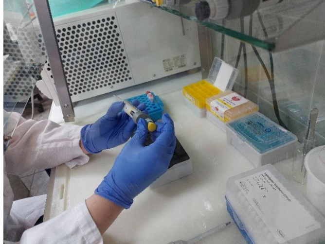
Slika 2. Priprema reakcijske smjese

Genotipizacija HFE izvođena je pomoću uređaja LightCycler® 1.2 Real time PCR System (Roche Diagnostics Ltd., Švicarska) (Slika 3.).