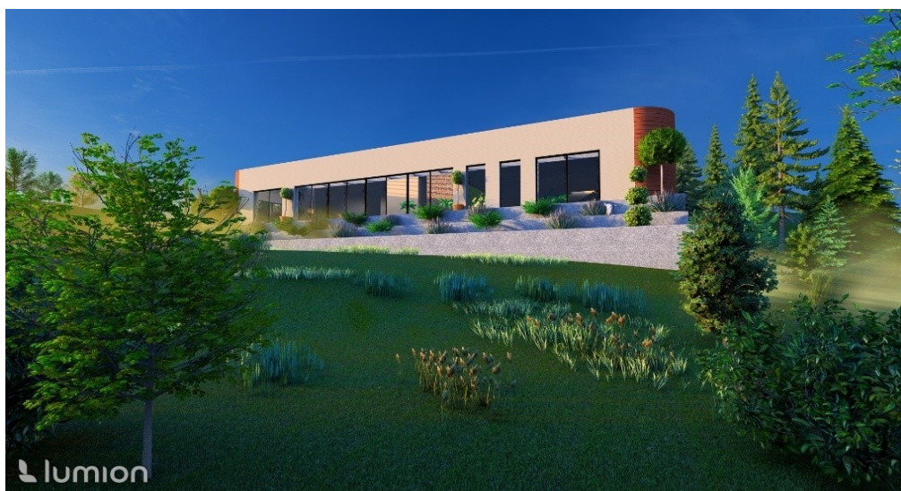
Slika 9. Pogled na wellness -objekt

Wellness -objekt predstavlja dodatnu ponudu održivom turizmu. Korištenjem održivih materijala i osiguravanjem pristupačnosti za sve goste ne samo da pruža luksuzno i opuštajuće iskustvo, nego podržava i ekološku odgovornost te svjesnost čime doprinosi cjelokupnoj održivosti resorta. Iako je resort prvotno zamišljen za boravak i opuštanje u prirodi, ne može se zanemariti ni to da turisti istodobno pokazuju interes i luksuz koji očekuju čak i od ovakvog tipa destinacija. Iz tog razloga osmišljen je i objekt jer se pretpostavlja da bi ispunio očekivanja i vrijeme potencijalnim gostima te samim time privukao i veći broj turista te različitu klijentelu.