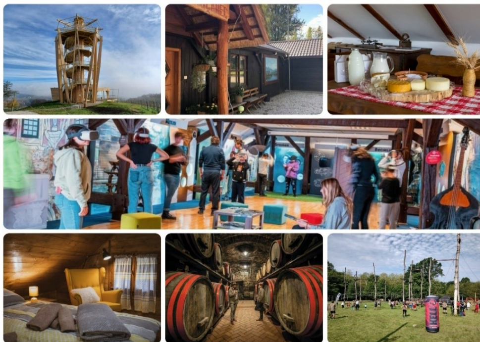
Slika 5. Atrakcije Međimurja

Najbliži je odabranoj lokaciji grad Mursko Središće koji je udaljen svega 5 kilometara, a na udaljenosti od samo 6 kilometara nalazi se Accredo centar koji nudi sportsko-rekreacijske i gastronomske mogućnosti te dodatno obogaćuje ponudu regije.