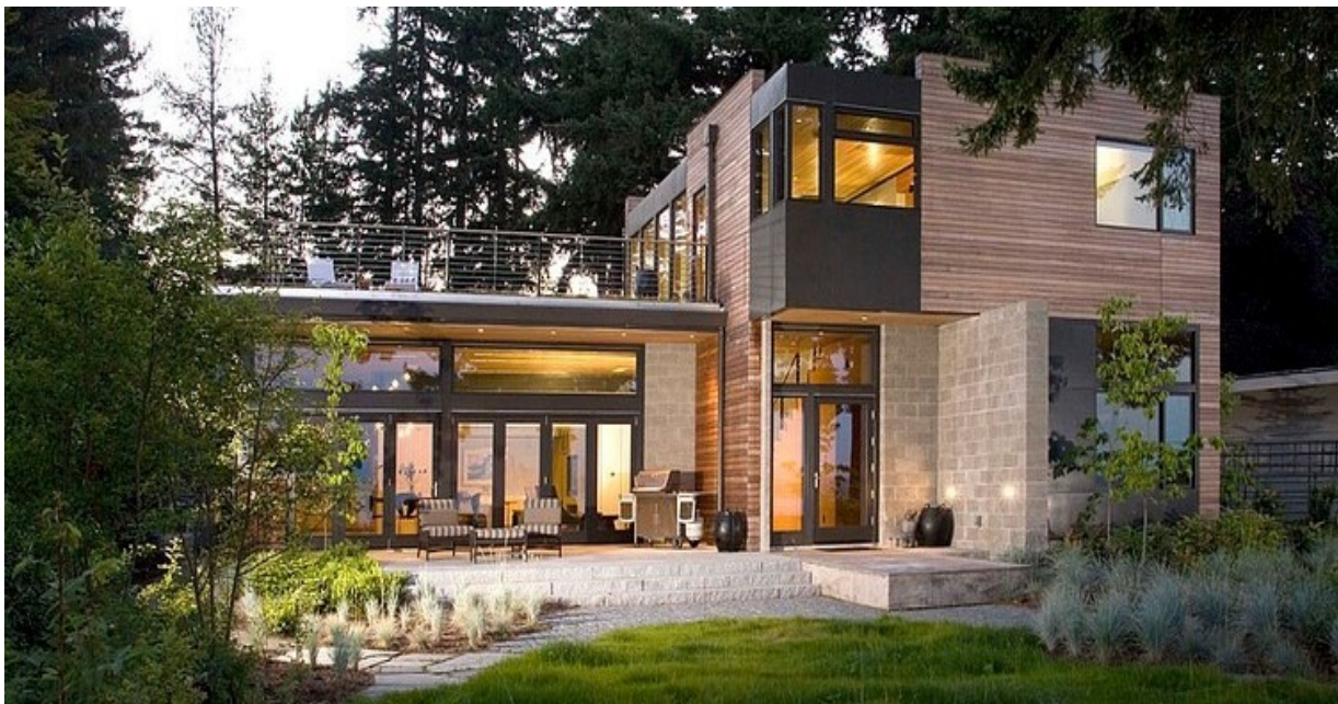
Slika 1. „The Ellis Residence“

Dobar je primjer održive arhitekture kuća „The Ellis Residence“.