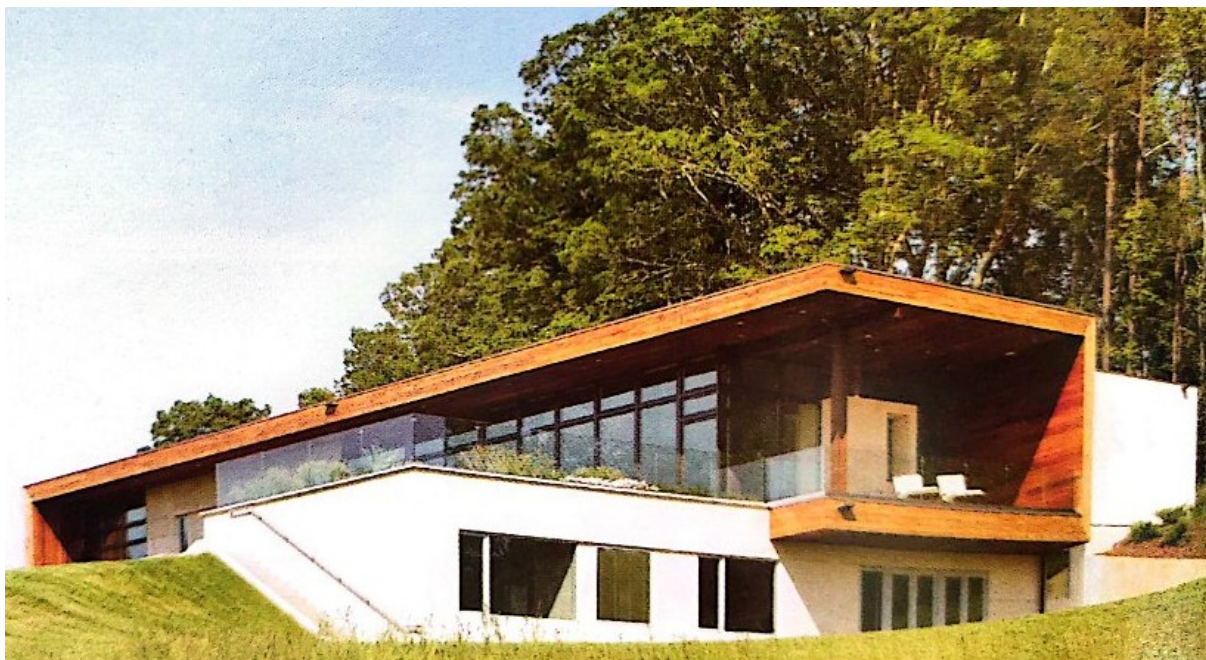
Slika 3. „Leicester House“

„Leicester House“ još je jedan izuzetan primjer jedinstvene arhitekture i dizajna. Objekt se nalazi u Americi te je završen 2009. godine. Projekt su ostvarili „SPG architects“. Od elemenata održivosti objekta ističu se geotermalno polje, zeleni krov na nižoj razini, reflektirajući bijeli krov na gornjoj razini te skupljanje kišnice. Bijeli reflektirajući krov prirodni je i učinkovit način koji pomaže spriječiti pregrijavanje objekta. [25]