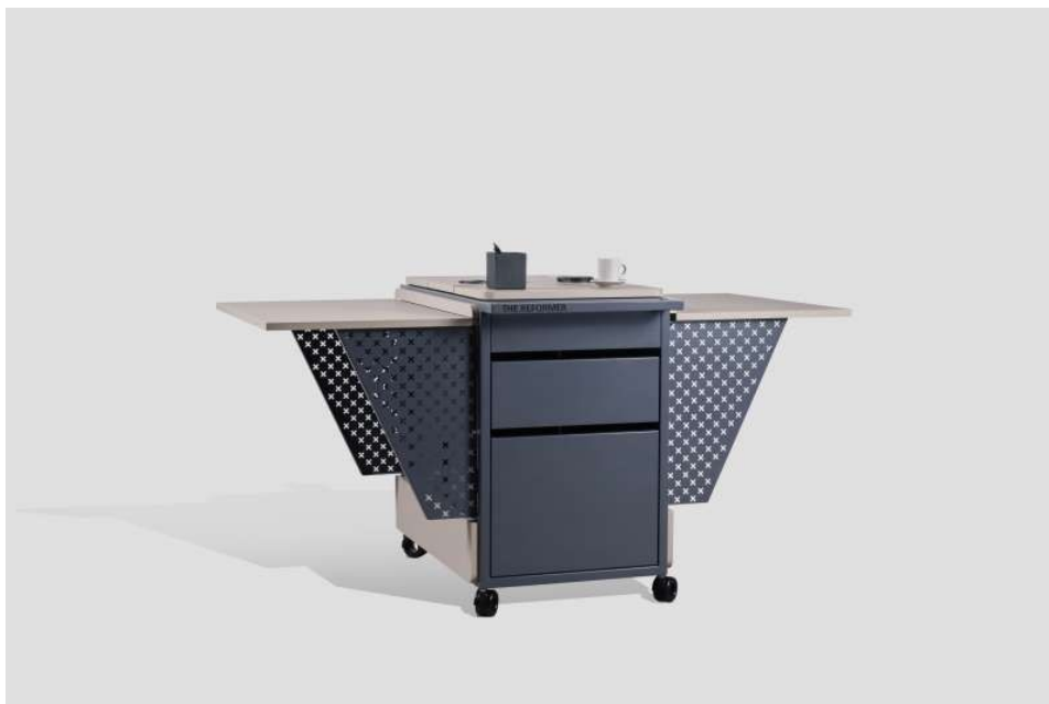
Slika 10 Vizualizacija – The Reformer

To je nova mobilna uredska jedinica pod brendom movo koja predstavlja značajno poboljšanje u odnosu na trenutna rješenja na globalnom tržištu, posebno u tehnološkim i funkcionalnim karakteristikama, dizajnu, tehnologiji i tehnici izvedbe, korisničkoj prihvatljivosti te sinergiji svih funkcionalnosti. Ključna komponenta projekta je implementacija industrije 4.0 u tvrtku, što uključuje robotizaciju i digitalizaciju procesa, čime će se značajno povećati procesna i organizacijska učinkovitost tvrtke Sobočan te stvoriti uvjeti za uspješno lansiranje inovativnog proizvoda na tržište. Ključni rezultati projekta uključuju inovirani proizvodni proces, unaprijeđen logistički proces gotovih dijelova proizvoda (uključujući upravljanje otpremom, pakiranjem i evidentiranjem sadržaja paleta) te stvaranje organizacijskih uvjeta za konkurentnu proizvodnju i uspješnu komercijalizaciju The Reformer (slika 10) mobilne uredske jedinice (Sobočan d.o.o., 2022.).