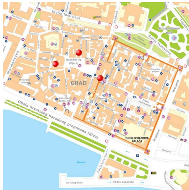
Karta Pjace i okolnih trgova 4

dogadaja, ipak postoji razina koja mora biti zadovoljena da ne bi pjevačima kvarila užitak. I sama sam se uvjerila slušajući pjevanje i Ispod ure i na pridruženim lokacijama kakva je kvaliteta pjevanja Ispod ure ; pjevači se trude biti glasniji no što je potrebno, izvođačka interpretacija ponekad u potpunosti izostaje, željeni intervali su nečisti, pjevači pjevaju u različitim tempima, nema potrebite hijerarhije u zvuku među dionicama. Prostori koji postaju drugim odredištima uslijed nezadovoljstva sudjelovanjem Ispod ure su na neki način preslik prostora Ispod ure u malom s mogućnošću kontroliranja uvjeta. Riječ je o malim trgovima koji su okruženi kućama, a do njih vode uske uličice ili prolazi. Svi ti trgovci, kao i Ispod ure su naslonjeni na Narodni trg , Pjacu (dva trga o kojima je riječ – kraj Martinskog prolaza i ispred Gage te Ispod ure su označeni na karti većim točkama bez numeracije).