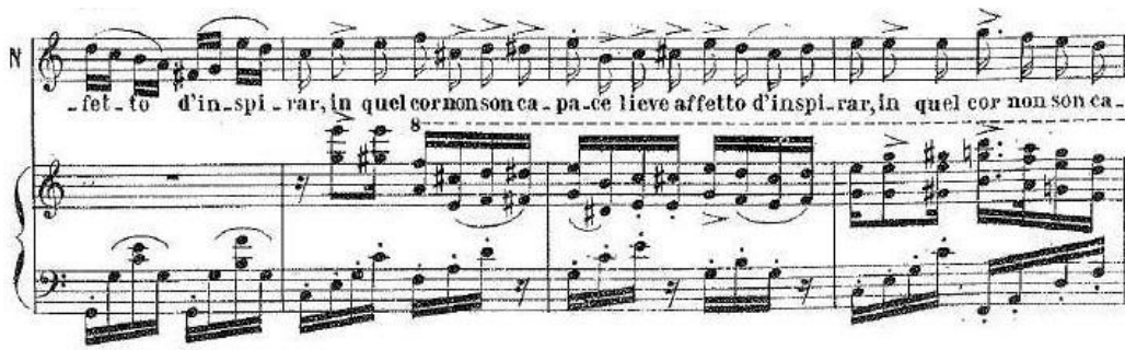
Primjer br. 1 / Ljubavni napitak / arija iz prvog čina: Quanto è bella, quanto è cara!

Nemorino je očaran Adininom ljepotom i inteligencijom, ali osjeća da je nije dostojan i da nije u stanju potaknuti nikakvu naklonost u njezinu srcu. Opisuje sebe kao neznalicu, nesposobnog da na pravi način izrazi svoje osjećaje, te čezne za načinom kako da ju pridobije. U frazi : " Ma in quel cor non son capace lieve affetto d'inspirar " ("al' u takvom srcu nisam sposoban nadahnuti ili probuditi ljubav"), na početku prvo pjeva u čistom C-duru, da bi kraj fraze otišao u e-mol koji odaje nemoć te nastavlja nabrajati Adinine sposobnosti, a sebe smatrajući nesposobnjakovićem. U cijeloj ariji je prisutan deskriptivni moment koji uz bel canto frazu zahtijeva i vrlo jasan izgovor. Na kraju, u repetitiji spomenutog teksta (koji je bio česta pojava romantičke opera te se kasnije izbjegava) prije kadence, Donizetti nam prvo glazbenim proširenjem te naglascima i alteracijama na slici dočarava i pod nos baca očitost njegove nesposobnosti, koju Nemorino gotovo razmaženo i djetinje ponavlja: