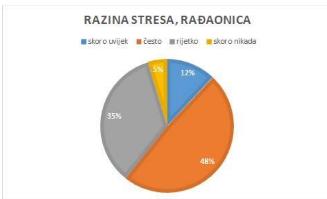
Slika 3. Prikaz razine stresa u postotcima u rađaonici

Na ove dvije slike prikazana je ukupna razina stresa na odjelu babinjača i u rađaonici u KBC-u Split.