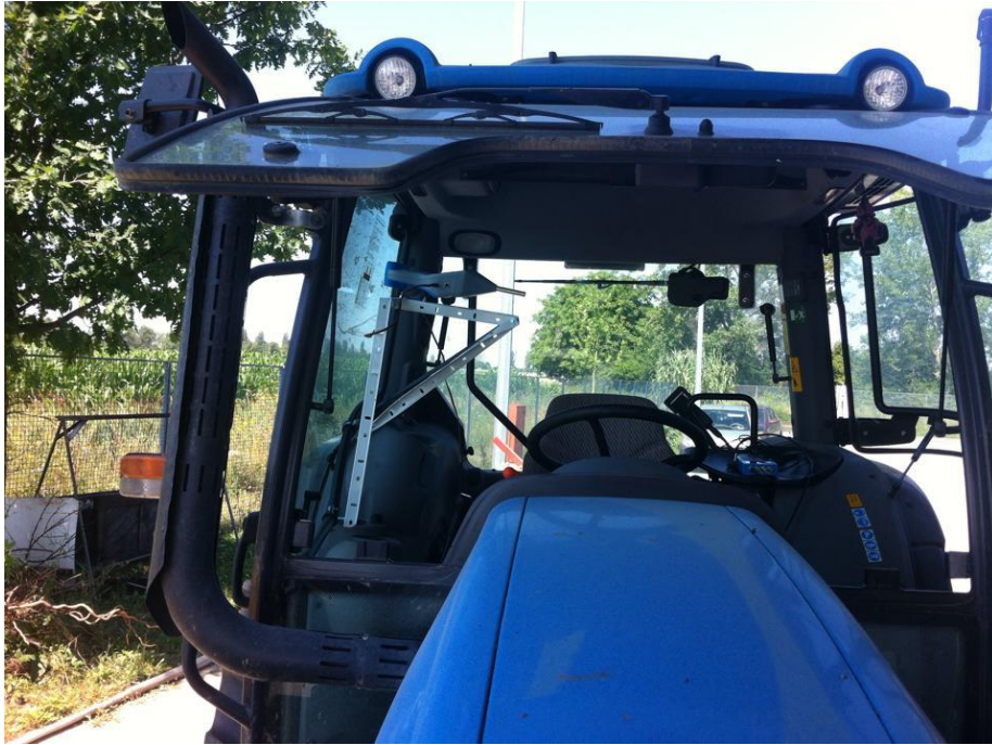
Slika 7. Uređaj za mjerenje u odnosu na referentnu točku sjedala rukovatelja

Prilikom istraživanja korišten je uređaj proizvođača METREL tipa Multinorm MI 6201 EU s pripadajućom zvučnom sondom (mikrofon klase B) istog proizvođača (slika 8.).