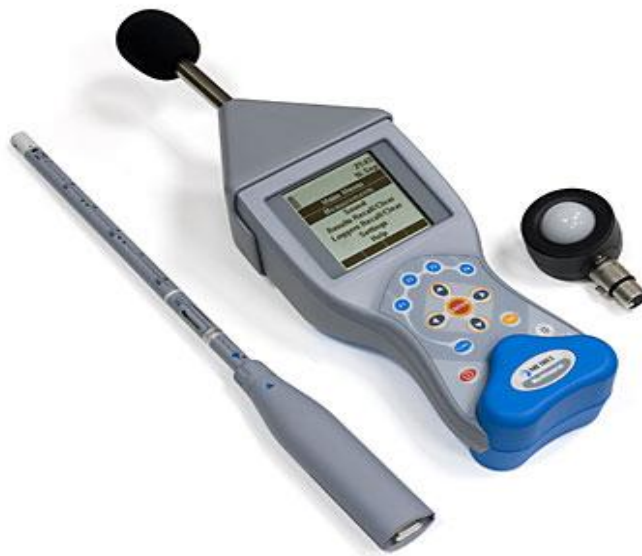
Slika 8. Uređaj proizvođača METREL tipa Multinorm MI 6201 EU

Prilikom istraživanja korišten je uređaj proizvođača METREL tipa Multinorm MI 6201 EU s pripadajućom zvučnom sondom (mikrofon klase B) istog proizvođača (slika 8.).