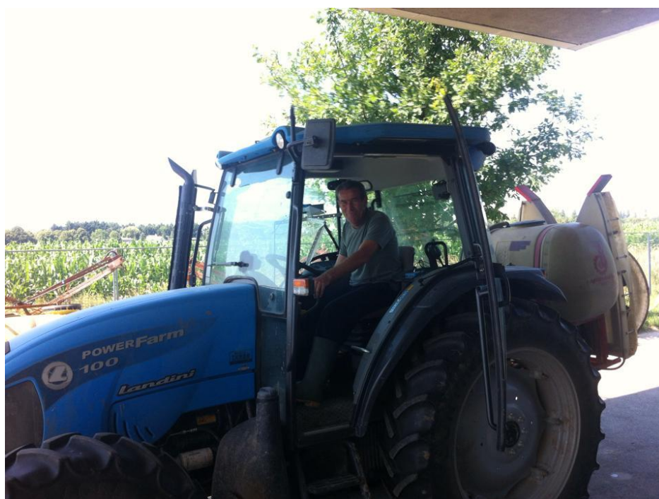
Slika 6. Raspršivač Agromehanika AGP 250 (Vlastiti izvor)

(Izvor: Agrotrade: Nošeni atomizeri Agromehanika Kranj od 100, 250 i 400 litara tip TN i TEN http://agrotrade.rs/267/noseni-atomizeri-agromehanika-kranj-od-100-250-i-400-litara-tip-tn-i-ten/ (22.5.2017.))