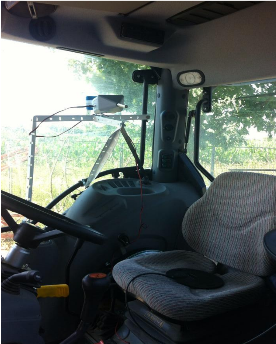
Slika 4. Uređaj za mjerenje razine buke

Sukladno propisanim normama HRN ISO 6396 mjerenje razine buke obavljeno je s lijeve i desne strane rukovatelja uz eksploatacijsku brzinu traktora u vremenu od 30 minuta. Prema normi HRN ISO 5131 određeno je gdje se uređaj za mjerenje buke mora nalaziti u odnosu na referentnu točku sjedala rukovatelja, a to je od sredine glave rukovatelja do razine sjedala u visini od 790\pm 20 mm i odmaknut od sredine glave 200\pm 20 mm s lijeve i desne strane, što je prikazano (Slika 4. i 7.)