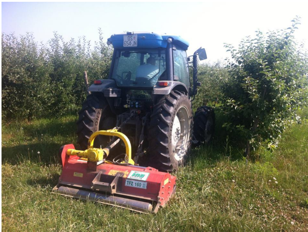
Slika 5. Malčer VOGER model TFZ 160 (Vlastiti izvor)

Malčiranje je način pripreme i obrade zemlje kojim se koriste prednosti velike količine organskog materijala koje možemo prikupiti, ili u svom dvorištu ili u susjedstvu. Korištenjem ovakvog materijala možemo stvoriti bogato i zdravo tlo za svoj vrt. Tijekom ovog mjerenja malčer se koristio u voćnjaku što prikazuje (slika 5.) (Izvor: Premakultura http://www.permakultura.hr/savjeti/51-malčiranje (22.5.2017.))