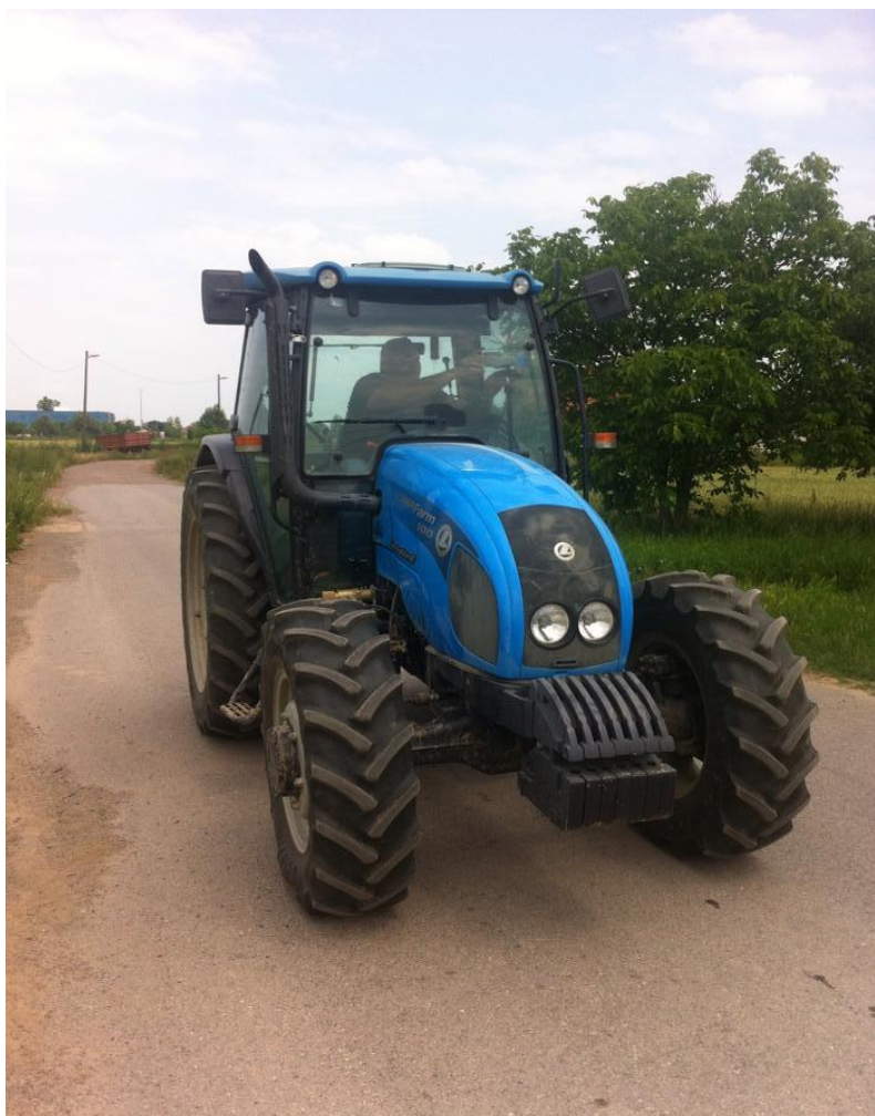
Slika 2. LANDINI POWERFARM DT 100A

Istraživanje je obavljano pri različitim agrotehničkim zahvatima buke na rukovatelja traktora pri različitim agrotehničkim zahvatima u odnosu na radne sate traktora provedeno je 2015. i 2016. godine na površinama Poljoprivredne i veterinarske škole u Osijeku. Mjerenje buke obavljeno je u skladu s propisanim normama HRN ISO 6396 koje se odnose na buku u unutrašnjosti kabine pri radu raspršivača i malčera. Razina buke mjerena je na traktoru LANDINI POWERFARM DT 100A (Slika 2.) koji je prilikom istraživanja 2015. godine imao 5800 radnih sati, a 2016. godine 6800 radnih sati.