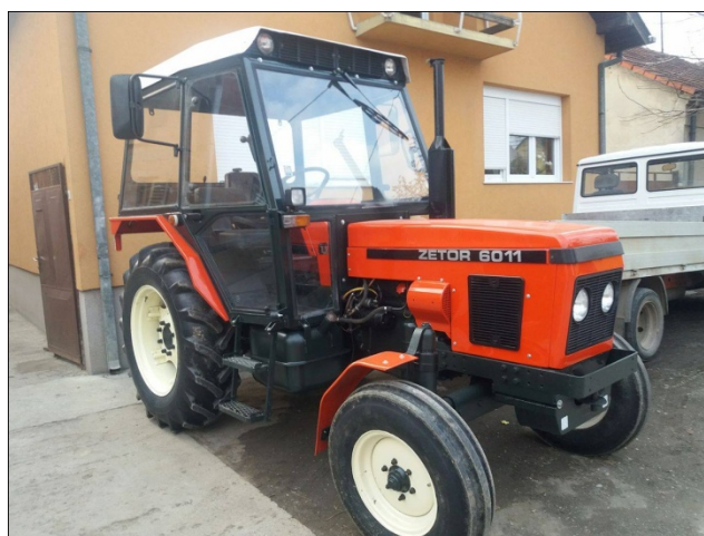
Slika 6. Traktor „ZETOR 6011“

Traktor „ZETOR 6011“, slika 6., ima četverocilindrični dizelski motor snage 44 kW/60 KS, traktor je kupljen kao polovan stroj 2010. godine.