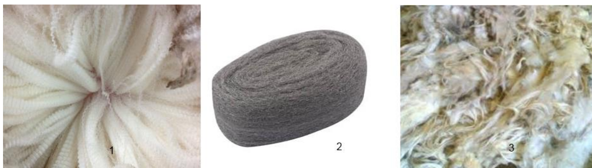
Slika 1. Fina vuna (1), Srednje fina vuna (2), Gruba vuna (3)

Mikronski rang vune se obično definira prema namjeni proizvoda. Vuna koja se koristi pri izradi odjeće je obično finija od vune korištene za unutarnji tekstil. Od 2008 vuna se više proizvodi zbog unutarnjeg tekstila nego vanjskog. ( http://www.iwto.org/wool-production , 23.8. 2017.)