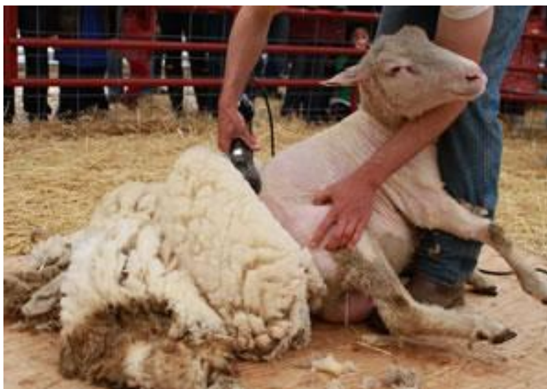
Slika 5. Šišanje ovce

Prvo razrađujemo plan šišanja gdje je potrebno razvrstati životinje po spolu, dobi i rasi, pripremiti životinje i odrediti načine šišanja. Zatim moramo odrediti vrijeme šišanja. Ovce i koze obično se šišaju jedanput godišnje u nekim zemljama i dva puta. Vuna šišana jedanput godišnje ima veću vrijednost na tržištu od one šišane dvaput. Šišanje se obično obavlja u ljetnim i proljetnim mjesecima, da se posao može što prije obaviti. Određivanje vremena šišanja bitno je i zbog proljetnog opadanja vune (linjanja), kako ne bi smo izgubili previše vune, što za posljedicu ima smanjene prinose. Uzročnik opadanja mogu biti i bolesti.