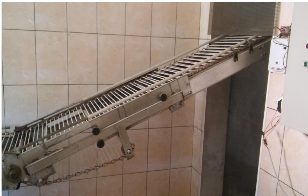
Slika 7. „Lift za jaja“

Na ovoj farmi se dnevno skupi od 4500 – 5000 jaja.