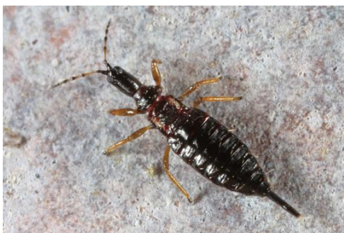
Slika 11. Resičar L. mali