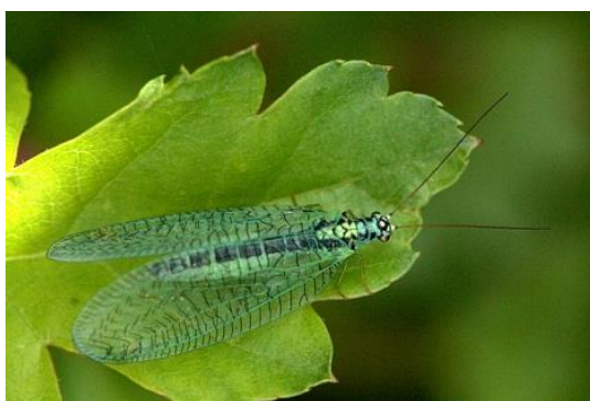
Slika 12. Mrežokrilka, vrsta C. perla .