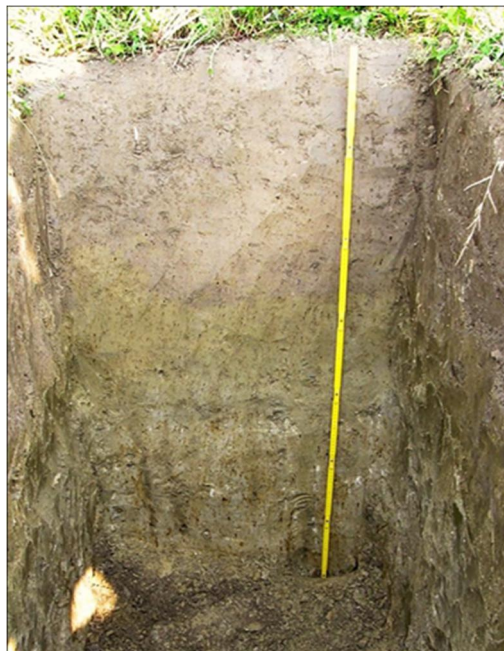
Slika 1. Profil tla na istraživanom lokalitetu

Istraživanjima je obuhvaćeno pet sustava obrade tla i tri razine gnojidbe dušikom. Sustavi obrade tla bili su slijedeći: