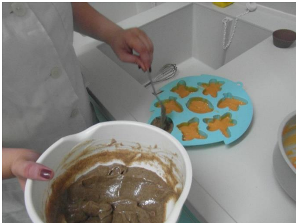
Slika 22.: Ulijevanje u kalupe