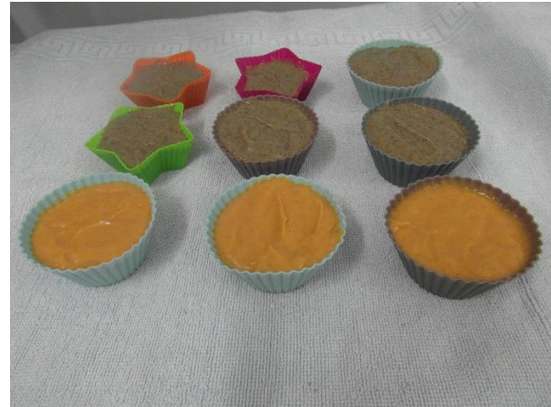
Slika 23.: Ulijevanje u kalupe