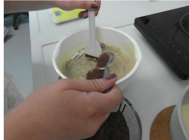
Slika 21.: Miješanje sastojaka u smjesi