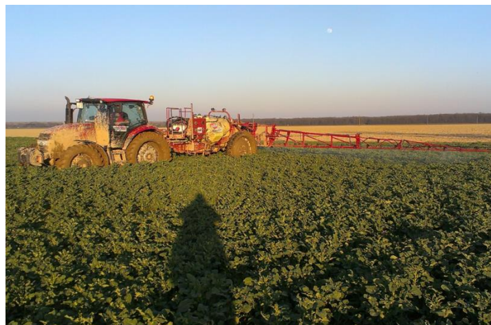
Slika 5. Prskanje usjeva protiv bolesti

Ovisno o godini tj. ekološkim uvjetima pojavljuju se bolesti uljane repice kao što su: koncentrirana pjegavost, suha trulež stabljike, bijela trulež i siva plijesan. Najznačajnija, koja se pojavljuje još tijekom jesen je suha trulež stabljike.