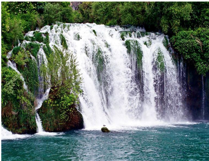
Slika 10. Roški slap

Prvi je slap Bilušića buk visok oko 22 m i dugačak 300 m. Skupina Roški slap (Slika 10) s 12 slapova i slapišta, visoka je od 25,5 do 15 m. Jedan je od najljepših u parku. Pod Roškim slapom počinje najveći ujezerni dio toka, dugačak 13 km, a širok oko 1 km. Na njemu su milinice, stupe i valjalice, od kojih su neke još u pogonu.