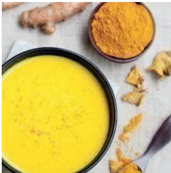
Slika 3. Kurkuma kao začin

Kurkuma se prvi puta pojavila kao začin u kuharici Hannah Glasse iz 1747. godine. Začin je upečatljive zlatno-narančaste boje, a pigmenti u začinu su fluorescentni (slika 3.). Prije same uporabe podanak kurkume je potrebno obraditi na slijedeći način. Podanak se kuha ili pari, potom se suši na suncu kako bi krajnji sadržaj vlage bio između 8 % i 10 %. Osušeni podanci se poliraju kako bi se uklonila gruba površina i na kraju se melju. Dobiveni prah zadržava boju dulje vremensko razdoblje, međutim kako navodi Wee i sur. (2011.) okus se s vremenom može promijeniti.