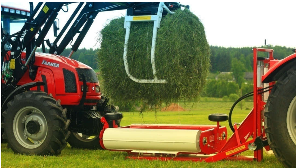
Slika 13. Stavljanje bale sijena na omotač bala (link 6.)

Nakon postupka baliranja dolazimo do omotavanja bala „stech“ folijom. Omotavanje je potrebno izvršiti kvalitetnom stech folijom, kako bi se istiskalo što više zraka, tj. da bala bude hermetički zatvorena za pokretanje anaerobne fermentacije biljne mase. Omatanje bala bi se trebala obavljati odmah nakon prešanja. Stoga gospodarstvo „Simentan-Commerce“ posjeduje omotač bala folijom na koji bala nakon izrade dolazi i omata se „strech“ folijom. Omotač bala posjeduje uređaj za rezanje i hvatanje folije a omotač ima brojač koji prikazuje broj omatanja, vrijeme rada, količinu bala i prosječnu količinu bala na sat.