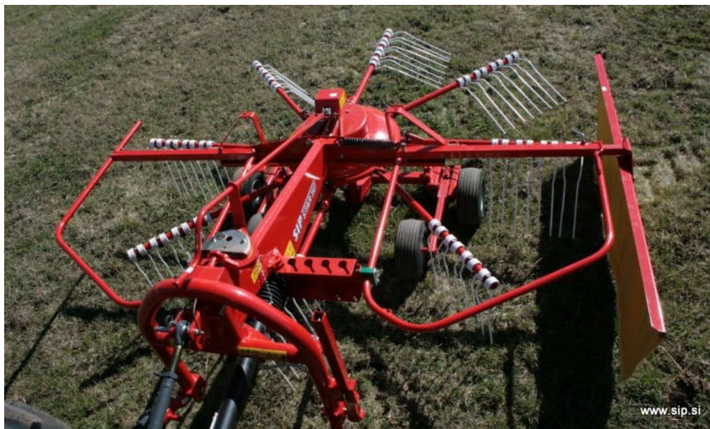
Slika 9. Rotacijske grablje SIP STAR 300/8 ALP (link 5.)

podizuju i odbacuju unatrag. Pri sakupljanju se postavljaju sakupljačke zavijese koje usmjeravaju biljnu masu. Brzina rada grablji ove izvedbe iznosi do 15 km/h.