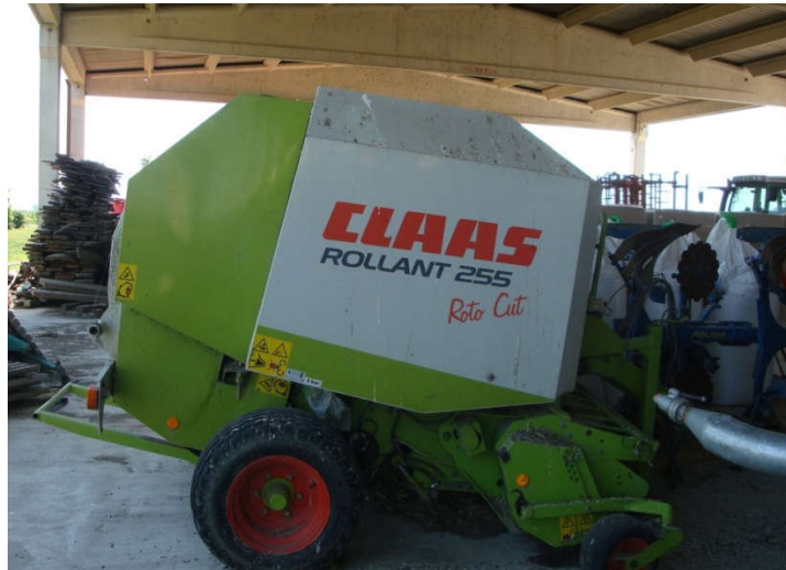
Slika 11. Preša Claas Rollant 255 Roto Cut za valjkaste bale

Osim preše za valjkast bale farma posjeduje i Claas Quadrant prešu za izradu četvrtastih bala dimenzija 120 x 90 cm. Takve preše vrlo kvalitetno prešaju sjenažu ali se u praksi na gospodarstvu ne koriste u tu svrhu jer je takve kvadratne bale vrlo teško omotati u foliju. Stoga se ovaj tip preše koristi konkretno za sijeno i slamu.