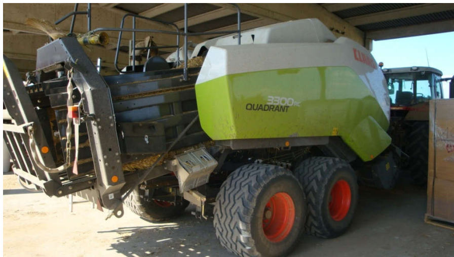
Slika 12. Claas Quadrant 3300 RC za kvadratne bala

Osim preše za valjkast bale farma posjeduje i Claas Quadrant prešu za izradu četvrtastih bala dimenzija 120 x 90 cm. Takve preše vrlo kvalitetno prešaju sjenažu ali se u praksi na gospodarstvu ne koriste u tu svrhu jer je takve kvadratne bale vrlo teško omotati u foliju. Stoga se ovaj tip preše koristi konkretno za sijeno i slamu.