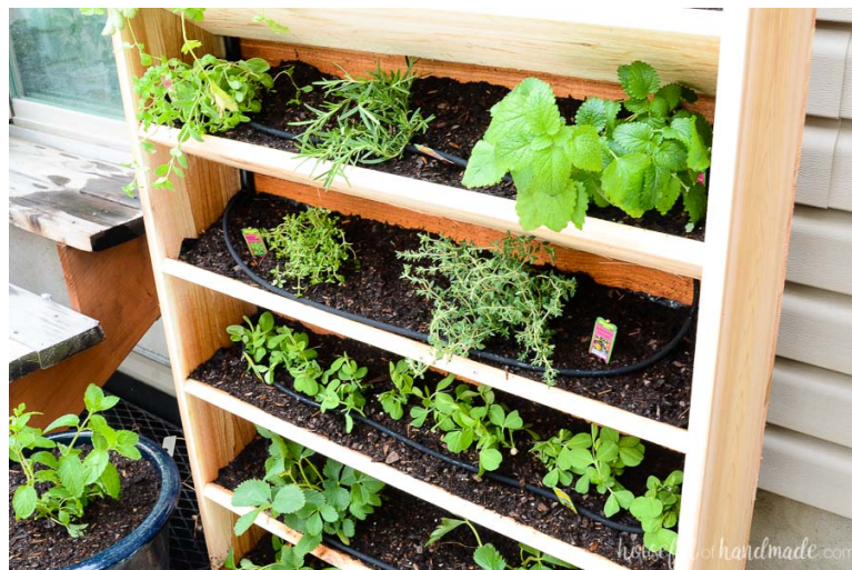
Slika 16. Sustav navodnjavanja „kap po kap“