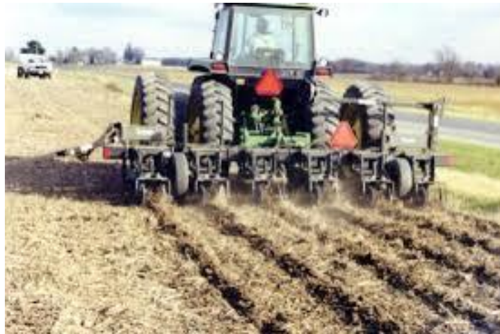
Slika 11. Konzervacijska obrada tla

Sustav u kojem se biljni ostaci (30%) zadržavaju na površini sjetvenog sloja, gdje je sjetveni sloj neravan, radi suzbijanja erozije i postignuća povoljnog odnosa tla i vode naziva se konzervacijska obrada tla. Svaka konzervacijska obrada tla pruža mogućnost smanjenja gubitka tla i vode u odnosu na konvencionalnu obradu. Uz tlo i vodu možemo dodati i energiju, vrijeme i troškove proizvodnje. Cilj konzervacijske obrade je stvoriti povoljan supstrat za uzgoj usjeva, sa zadržavanjem biljnih ostataka na površini tla, i na mjestima gdje obrada nije provedena primijeniti herbicide za uništenje korova (Slika 11.).