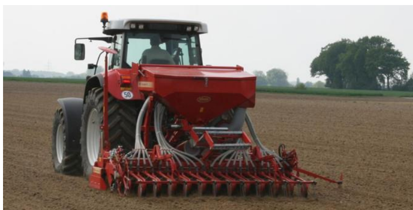
Slika 9. Primjer sijačice za pšenicu

Preporučuje se način sjetve pšenice strojem odnosno sijačicom (Slika 9.). Postoje dva sustava doziranja sjemena kod sijačica, a to su sijačice s pojedinačnim doziranjem sjemena i sijačice sa centralnim doziranjem sjemena (Zimmer i sur., 2009). Sijačicom postizemo povoljan razmak između redova, povoljnu dubinu, dobar vegetacijski prostor i raspored sjemenki. U optimalnim uvjetima razmak između redova bi trebao iznositi 8 cm (Gagro, 1997). Sjetva pšenice na težim i vlažnijim tlima treba biti izvedena pliće, dok za lakša i sušnija tla sjetva treba biti obavljena na većoj dubini zbog lakšeg ostvarivanja kontakta sjemena i vlage. Dubina sjetve bi trebala biti od 4 do 6 cm (Gračan i Todorić, 1990).