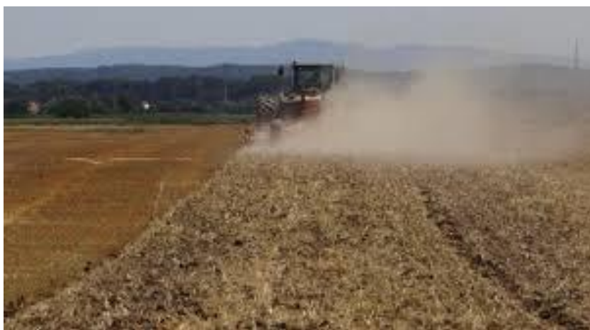
Slika 12. Konzervacijska obrada tla tanjuračem

U sustavu konzervacijske obrade može se koristiti i tanjuranje za pripremu sjetvenog sloja (Slika 12.).