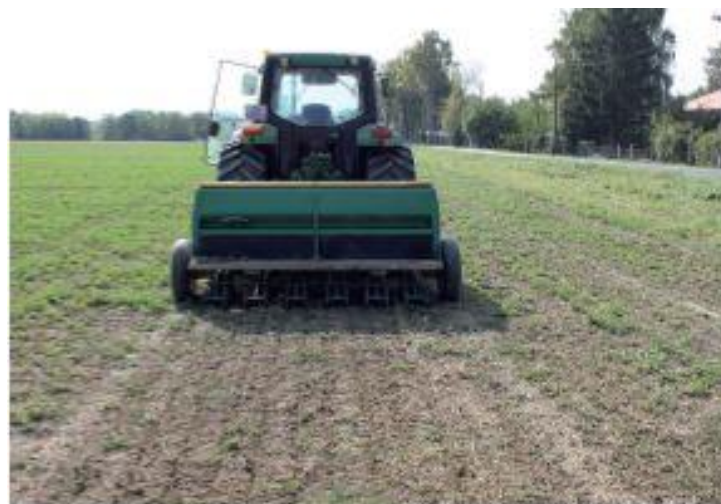
Izravna sjetva u postojeći travnjak

Nedostatci no-tillage sustava su u zahtijevanju nove tehnologije za određenim znanjem proizvođača. Proizvođač mora poznavati: vremensko usklađivanje i primjenu gnojiva koji se razlikuju od klasične gnojidbe, dubinu sjetve, na koji se način ostvaruje kontakt sjemena s tlom i pokrivenost sjemena bez usitnjenog sjetvenog sloja, pravilnu primjenu odgovarajućih herbicida i insekticida u borbi protiv korova i širenja štetnika u zaraženim biljnim ostatcima.