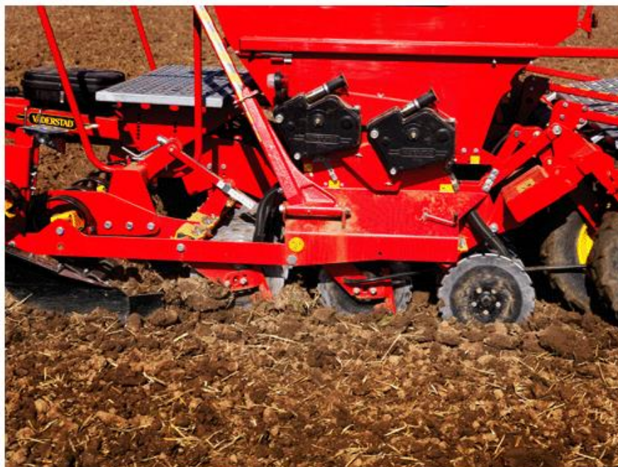
Slika 14. Stroj za direktnu sjetvu

Uz izostavljenu obradu tla vezan je i neuredan izgled površine koji ostaje, dok se ne formira sklop usjeva, a koji sadrži socijalne konotacije, pa na takav način utječe na izbor no-till sustava (Slika 14.).