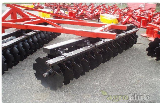
Slika 7. Tanjurača

Ukoliko se sjetvospremačem ne može pripremiti tlo ili ako je tlo sabijeno i zakorovljeno potrebno je prethodno obaviti par prohoda tanjuračem (Slika 7.) ili drljačem. Ukoliko je potrebno na suhim tlima može se proći valjkom da se postigne pravilno slijeganje tla. Kod vlažnih tala preporučuje se izbjegavanje valjaka zbog zbijanja tla (Mađarić, 1985). Priprema tla je moguća i kombiniranim oruđima gdje se zajedno sa predsjetvenom pripremom tla obavlja i sjetva. Ovaj način pripreme povećava ekonomičnost i smanjuje gaženje tla.