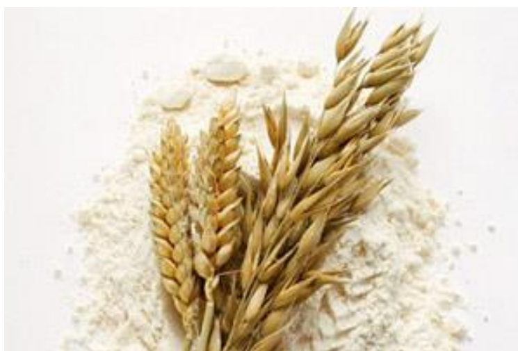
Slika 2. Pšenično brašno

Značaj pšenice je i u agrotehnici. Pogodna je u plodoredu i kao pretkultura za druge kulture. Nakon žetve pšenice koja se relativno rano žanje ostaje dovoljno vremena do sjetve idućeg usjeva za dobru i kvalitetnu obradu tla.