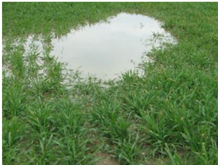
Slika 3. Suvišak vode

Posljedice viška vode (Slika 3.) su polijeganje usjeva, slabija kvaliteta zrna, vegetacija traje duže, zakorovljenost i jači intenzitet bolesti (Gagro, 1997).