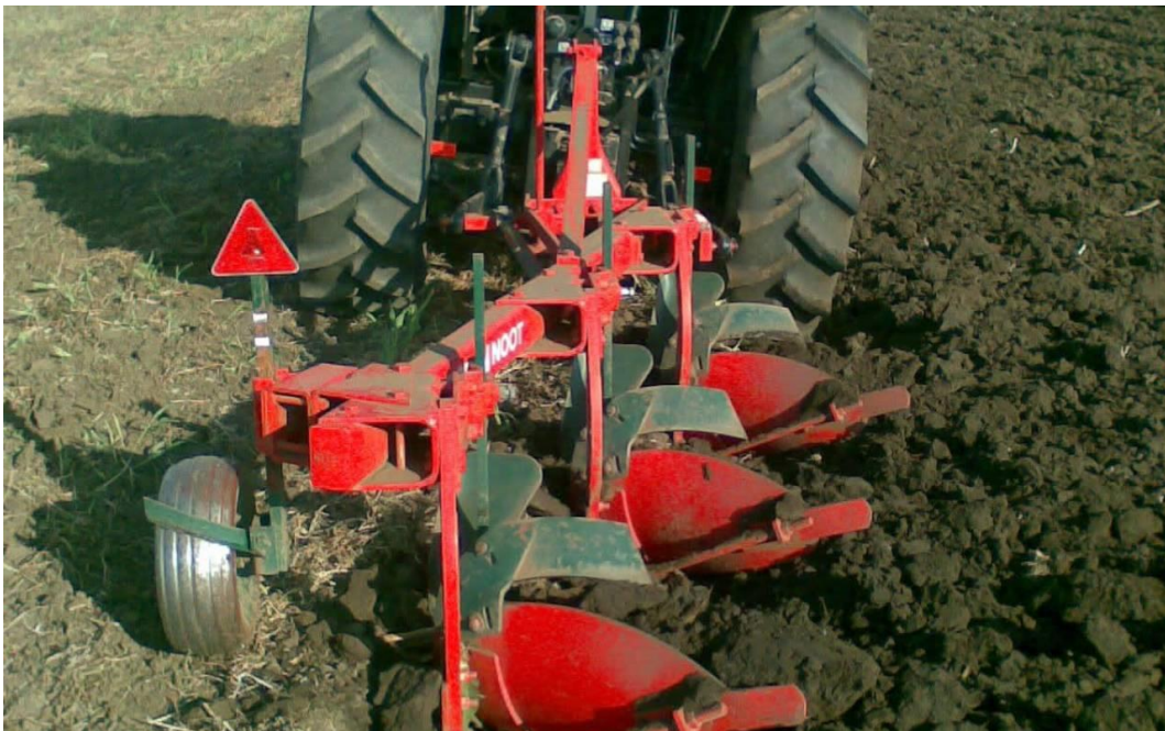
Slika 5. Predsjetveno oranja

Predsjetveno oranje se obavlja na dubinama od 25 – 30 cm i obavlja se oko petnaestak dana prije sjetve (Slika 5.). Poslije srednje kasnih pretkultura se može izvesti plitko oranje na dubinu od desetak centimetara, a zatim na punu dubinu predsjetveno oranje. Nakon kasnih pretkultura obavlja se samo predsjetveno oranje zbog kratkog vremena koje ostaje za pripremu tla. Osnovnom obradom tla postizemo normalan razvoj biljaka i utječemo na visinu prinosa.