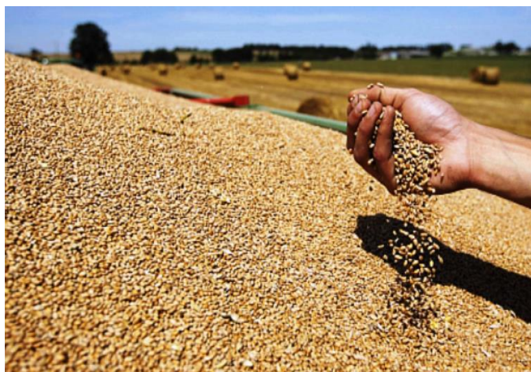
Slika 1. Pšenica u znu

Među najvećim proizvođačima pšenice su Kina, Indija, SAD, Rusija, Francuska i Kanada. Najviši prinosi pšenice su uglavnom u Njemačkoj i Francuskoj, dok je prosječan prinos u svijetu između 2,5 i 3 t/ha, a u Hrvatskoj oko 4 i 4,5 t/ha.