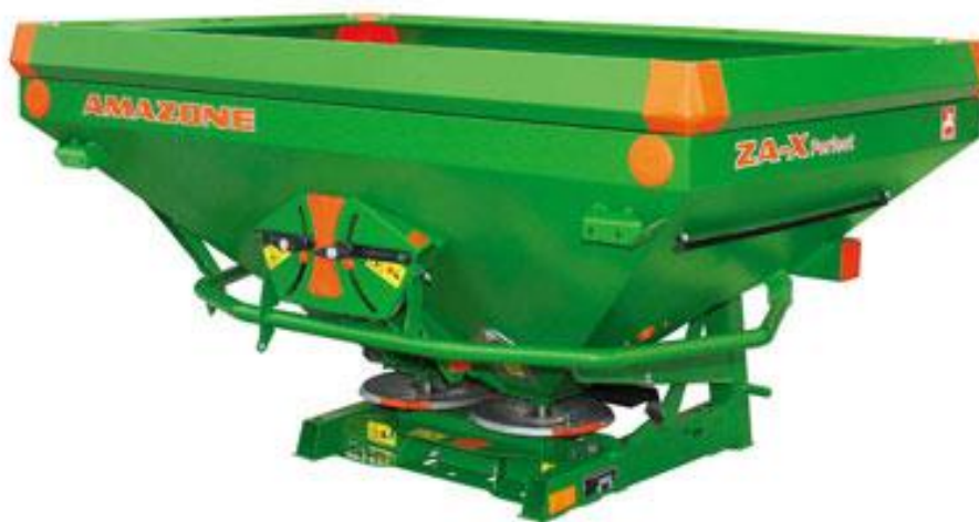
Slika 8. Rasipač za umjetna gnojiva

Dobar rast i razvoj pšenice ovisi o pristupačnosti hraniva u tlu. S odgovarajućim količinama hraniva u svim fazama razvoja pšenice postižu se visoki i stabilni prinosi. Gnojidba mineralnim gnojivima je redovna agrotehnička mjera kod pšenice, a posebice gnojidba s dušikom, fosforom i kalijem (Vukadinović i Lončarić, 1998.). Gnojidba se obavlja rasipačima (Slika 8.).