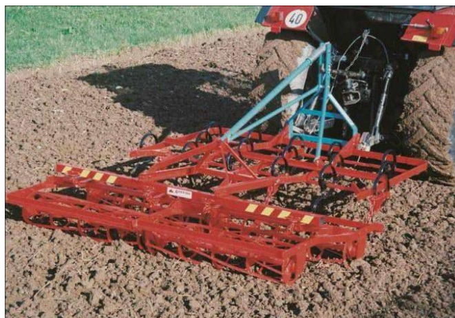
Slika 6. Sjetvospremač

Ako je tlo dobro slegnuto za pripremu tla se koristi sjetvospremač (Slika 6.). Trebalo bi se izbjegavati preveliko usitnjavanje tla u jesen, jer malo veće grude mogu zaštititi mlade biljke od vjetrova u zimskom periodu. Potreban je određen rahli sloj s kojim se postiže ujednačeno klijanje i nicanje usjeva.