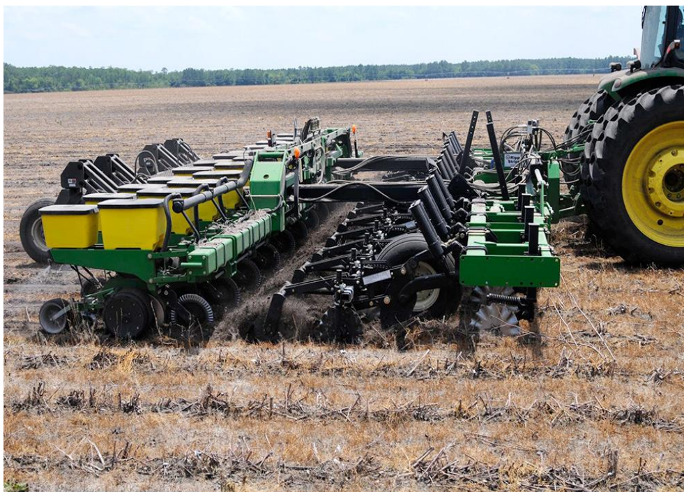
Slika 10. Stroj za minimalnu obradu tla

Za područja s više od 700 mm oborina godišnje primjenjuje se sjetva u živi malč, tj. sjetva sjemena u trake na površinama gdje je vegetacija aktivna. Ovakav sustav rada štiti tlo od erozije i tvari iz atmosfere, te čuva humus tla (Mihalić, 1985). Kod područja s manje od 700 mm oborina godišnje primjenjuje se sjetva u mrtvi malč (Slika 10.). Sjetva se obavlja na isti način kao i kod živog malča, a uz zaštitu od tvari iz atmosfere i erozije vodom ili vjetrom, mrtvi malč služi i za potiskivanje korova.