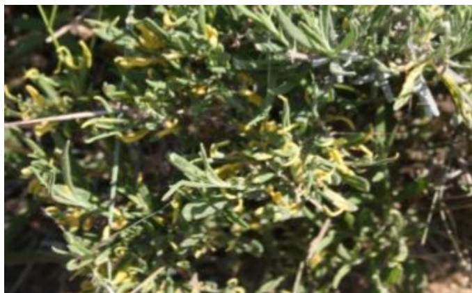
Slika 6. AMV bolest na lavandi

Stoga se preporučava da se ostavi određeno područje lucerne i tretira se insekticidima. AMV se također može prenositi sjemenom, peludom, mehaničkom inokulacijom biljnog soka i parazitskom biljnom vrskom ( Cuscuta ). Kombinacija biljaka zaraženih sjemenom i širenje lisnih uši uglavnom rezultira visoku razinu infekcije. Glavna mjera zaštite je da proizvođači osiguraju zdrav sadni material kod presadnica, kontrola korova, izbjegavanje uzgoja usjeva uz zaražene pašnjake i druge kulturne prakse kako bi se smanjio AMV. Mora se voditi računa da nema prisutnosti lisnih ušiju.