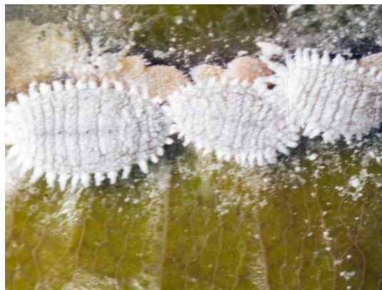
Slika 10. Limunov crvac ( Pseudococcus citri )

neprijatelja kao što su: božje ovčice, muhe tahine i ose najeznice. U svijetu se suzbija biološkim putem pomoću božje ovčice Cryptolaemus montrouzieri i parazitske osice Leptomastix dactylopyii . Mehaničkim putem moguće ih je ukloniti ručno skidanjem s biljaka ili pomoću usisavača pažljivo usisati da se ne oštete biljke. Kako ne bi dospjele s vinove loze na pravu lavandu preporučuje se struganje stare kore i zimsko prskanje čokota te primjena insekticida u vrijeme vegetacije. U RH prema FIS bazi od aktivnih stvari koristi se klorpirifos-metil (pripravak Reldan 22 EC). Preporučuje se da se lavanda ne uzgajaju u blizini zaraženih pašnjaka, vinove loze, te voća kao što su smokva, limun, naranda i dr.