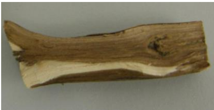
Slika 7. Fusarium sporotrichioides simptomi na korijenu lavande

njihove makrokonidije blago zakrivljene i obično imaju tri do pet septa. Mnogi od njih imaju brojne smeđe klobučaste hlamidospore promjera 7-15 \mu\text{m} i služe kao važna značajka za njihovo razlikovanje. Glavna mjera zaštite je da proizvođači osiguraju zdrav sadni material kod uzgoja, te treba voditi računa o plodoredu.