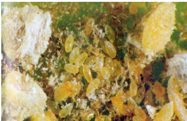
Slika 12. Lozin medić ( Pseudococcus vitis )