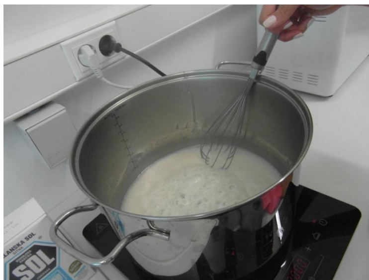
Slika 16. Kuhanje šećera i mlijeka (Janković, 2019.)

Prvi korak u izradi čokolade od kobiljeg mlijeka je nauljiti i zagrijati posudu. Zatim se odvažuje 1 del mlijeka i \frac{1}{2} kg šećera. Šećer i mlijeko treba kuhati dok se šećer ne otopi i smjesa ne bude vrela (Slika 16.). Smjesu treba maknuti s vatre i dodati 250 g kobiljeg mlijeka u prahu (Slika 17.) i 50 g kakaa (Slika 18.) koje smo prethodno pomiješali (Slika 19.). Potrebno je brzo miješati jer se smjesa brzo stegne. Nakon miješanja potrebno je dodati 250 g kokosove masti (Slika 22.), te dodatno miješati dok se kokosova mast ne otopi (Slika 23.). Gotovu smjesu treba uliti u kalupe i ostaviti da se stegne (Slika 24.).