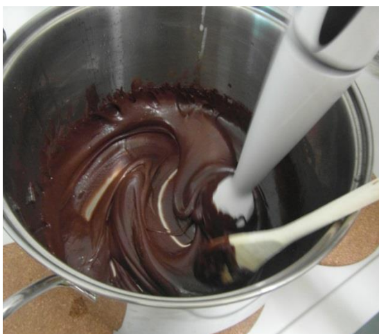
Slika 23. Miješanje smjese (Janković, 2019.)