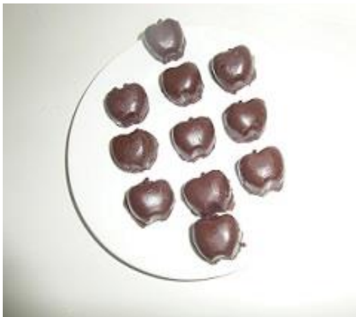
Slika 27. Čokolada kalup jabuke (Janković, 2019.)