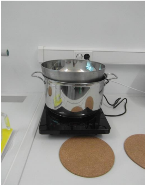
Slika 14. Pribor (Janković, 2019.)