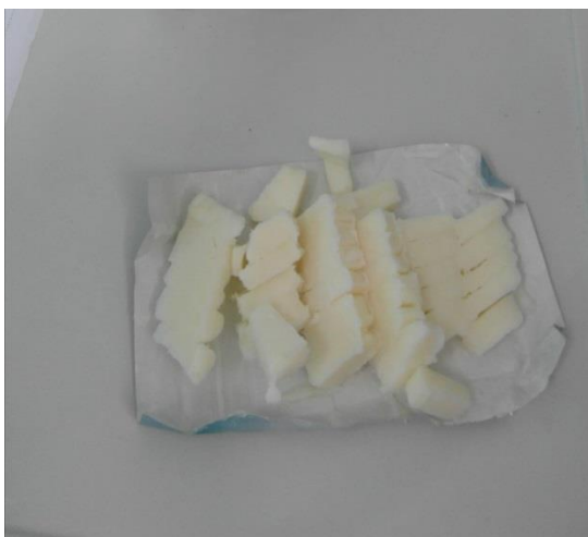
Slika 21. 250 g kokosove masti (Janković, 2019.)