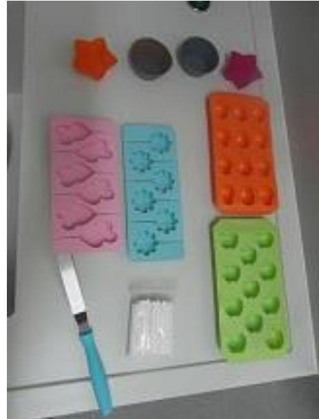
Slika 15. Kalupi (Janković, 2019.)

Prvi korak u izradi čokolade od kobiljeg mlijeka je nauljiti i zagrijati posudu. Zatim se odvažuje 1 del mlijeka i \frac{1}{2} kg šećera. Šećer i mlijeko treba kuhati dok se šećer ne otopi i smjesa ne bude vrela (Slika 16.). Smjesu treba maknuti s vatre i dodati 250 g kobiljeg mlijeka u prahu (Slika 17.) i 50 g kakaa (Slika 18.) koje smo prethodno pomiješali (Slika 19.). Potrebno je brzo miješati jer se smjesa brzo stegne. Nakon miješanja potrebno je dodati 250 g kokosove masti (Slika 22.), te dodatno miješati dok se kokosova mast ne otopi (Slika 23.). Gotovu smjesu treba uliti u kalupe i ostaviti da se stegne (Slika 24.).