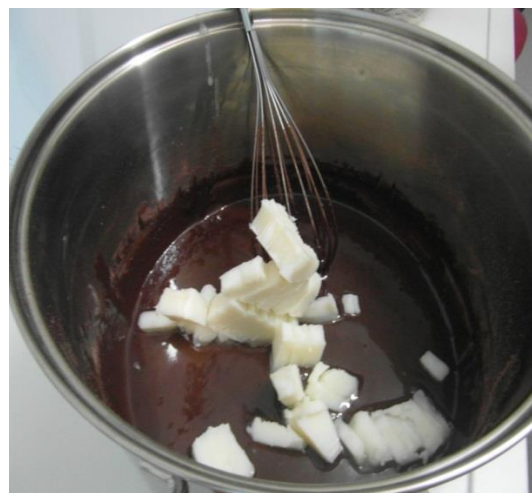
Slika 22. Dodavanje kokosove masti (Janković, 2019.)