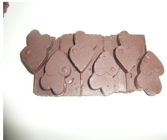
Slika 28. Čokolada u velikom kalupu (Janković, 2019.)

Čokolada sadrži veliki udio suhe tvari kakovih dijelova. Polifenoli u kakaovom zrnu imaju pozitivne učinke na zdravlje ljudi, zbog čega se kakao ubraja u glavnu namirnicu svake čokolade. Na tržištu se sve više pojavljuju čokolade s manjim udjelom šećera, te bogatim funkcionalnim sadržajem. U proizvodima čokolade koriste se termolabilne sirovine, različitih aroma i tekstura, te je za izradu kvalitetnog proizvoda bitan svaki detalj.