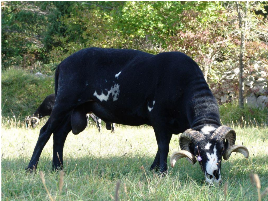
Slika 4. Istarska ovca

Pasmina istarska ovca uzgaja se na području Istre, gdje je i nastala. Ova pasmina pripada skupini ovaca kombiniranih proizvodnih osobina. Istarska ovca isključivo je namijenjena proizvodnji mlijeka, koje se kasnije prerađuje u polutvrđi, punomasni ovčji sir. Istarska ovca proizvodi od 220-350 l mlijeka. Temeljna boja runa je bijela sa smeđim, crnim ili crno-smeđim pjegama. Visina grebena je 76-80, a kod ovnova 82-88 cm. Poželjna tjelesna masa ovaca iznosi 60-70 kg, a ovnova 80-100 kg. Plodnost u postocima iznosi 130-150. Tjelesna masa janjadi u dobi od 45-60 dana iznosi 18-22 kg (HSUOK, 2005.).