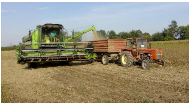
Slika 16. Žetva soje

Žetva soje izvršena je žitnim kombajnom Deutz-Fahr 10.09.2019. godine kada je vlaga bila 11,8 % (Slika 16).