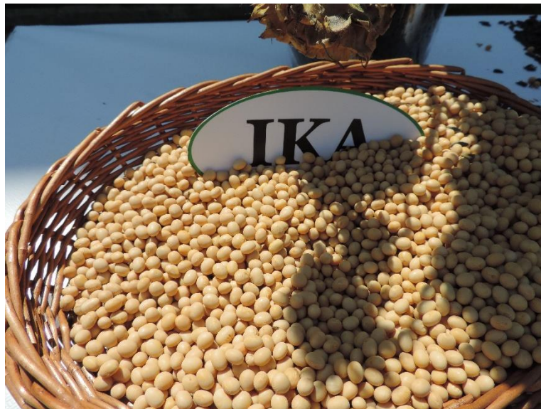
Slika 14. Zrno sorte Ika