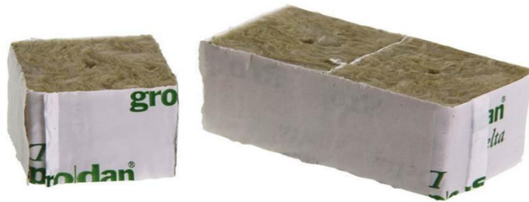
Slika 9. Supstrat kamene vune