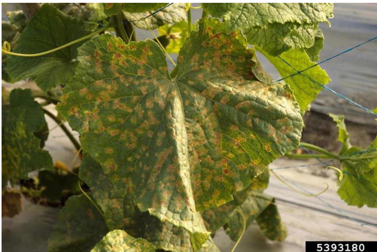
Slika 5. Pseudoperonospora cubensis