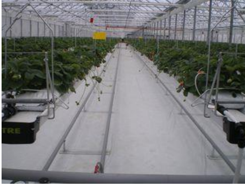
Slika 11. Cijevni razvodi u hidroponu