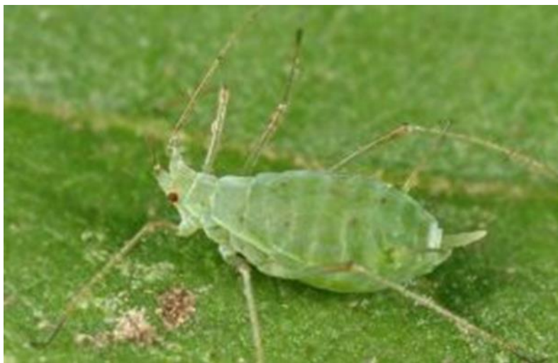
Slika 6. Lisne uši