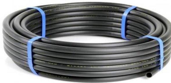
Slika 10. Cijev za navodnjavanje PE 16mm