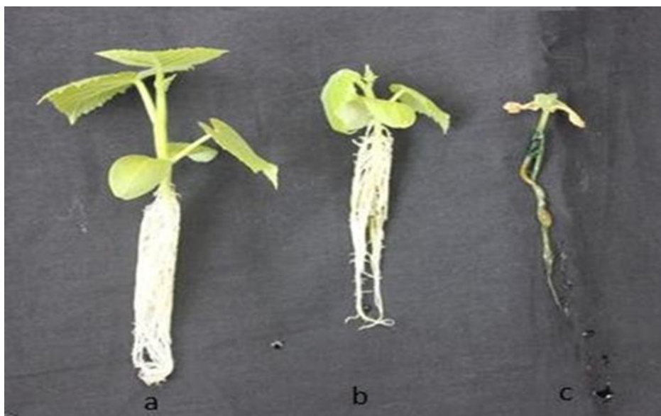
Slika 7. Tretman sjemena krastavca sa pripravkom Trichoderma ssp. (a) i bez pripravka (b) i (c)