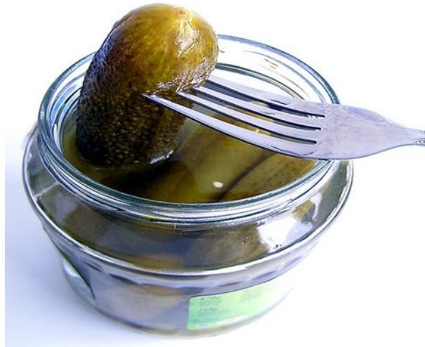
Slika 1. Krastavac kornišon

Pošto je krastavac termofilna biljka, temperature za nicanje krastavca trebaju biti između 22-24 °C, za rast i razvoj 18-20 °C dnevne, a noćne ne ispod 13 °C. Zalijevanje se obavlja prema potrebi i uvijek pravovremeno, pri čemu valja paziti da se ne kvase biljke zbog razvoja bolesti. Relativnu vlažnost zraka treba održavati na razini 85 – 90 % (Parađiković, 2009.).