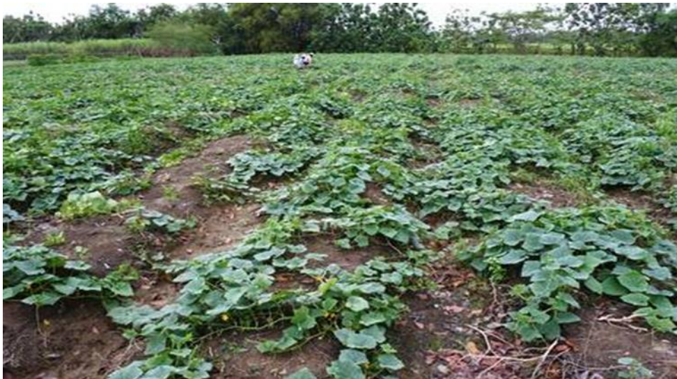
Slika 2. Polje krastavaca