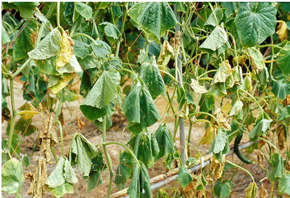
Slika 4. Fusarium oxysporum na krastvacu

Fusarium oxysporum (fuzarijsko venuće) je bolest ponovljenog ili prečestog uzgoja krastavaca na istoj površini za vrijeme toplog vremena (Slika 4.). Uzročnik prezimljuje na zaraženim biljnim ostacima te se prenosi na zdrave biljke. Uzrokuje začepljenje provodnih snopića stabljike uslijed čega se suši čitava biljka, a jedina uspješna mjera borbe protiv fuzarijskog venuća je pridržavanje plodoreda i upotreba zdravog, tretiranog sjemena.