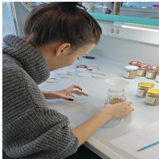
Slika 13. Procjena mortaliteta odraslih jedinki R. dominica