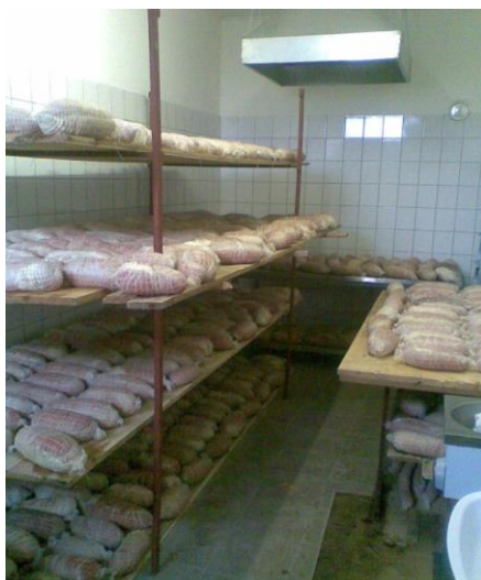
Slika 2. Prerada O.P.G. Mađarević

Obiteljsko gospodarstvo je započeo s prvim fazama testiranja tržišta kod prerade i prodaje suhomesnatih proizvoda, s ograničenim kapacitetima. Na Slici 2 se može vidjeti dio prerađevina i priprema svježeg mesa za suhomesnate proizvode.