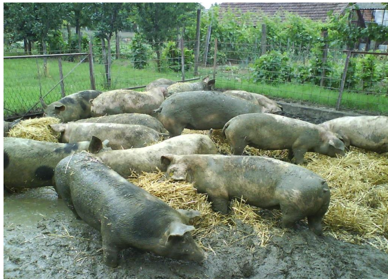
Slika 1. Tov poluotvorenog tipa na OPG-u Mađarević

U neposrednoj blizini se nalazi i objekt tzv. farma tovljenika koji ima i utovarnu rampu preko za transport tovljenika do klaonice. Farma je prenamijenjena za uzgoj za vlastite potrebe, na način da tovljenici borave u takozvanom tovu poluotvorenog tipa što je vidljivo na Slici 1. koja prikazuje tov poluotvorenog tipa na OPG Mađarević.