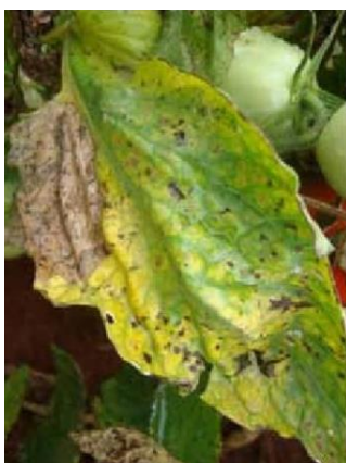
Slika 33 Pjegavost lista, Glasnik zaštite bilja 3/2019

Bakterijsku pjegavost rajčice uzrokuje bakterija Pseudomonas syringae pv. tomato . Širi se zaraženim sjemenom (Ivić, 2019.). Na površini biljaka i biljnim ostacima može opstati pola godine. Razvija se u uvjetima visoke vlage i na temperaturama 18-24 °C što odgovara temperaturi na kojoj se razvija rajčica. Simptomi na listu (slika 33) su crne pjege okružene klorotičnim prstenovima koje se kasnije spajaju. Cijeli list može nekrotizirati. Na plodovima se stvaraju okrugle lezije čiji je promjer nekoliko milimetara (slika 34). Moguće je da lezije popucaju.