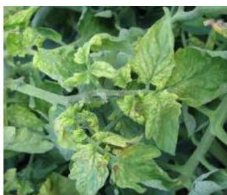
Slika 32 Mozaične mrlje, Tomato Disease Field Guide , 2017.