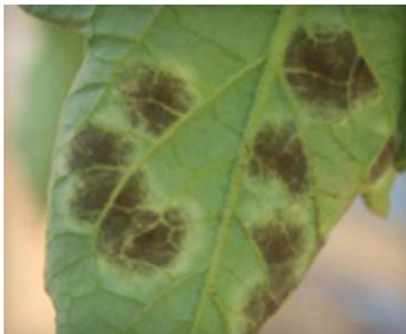
Slika 50 Sporulacija na naličju, Tomato Disease Field Guide, 2017.