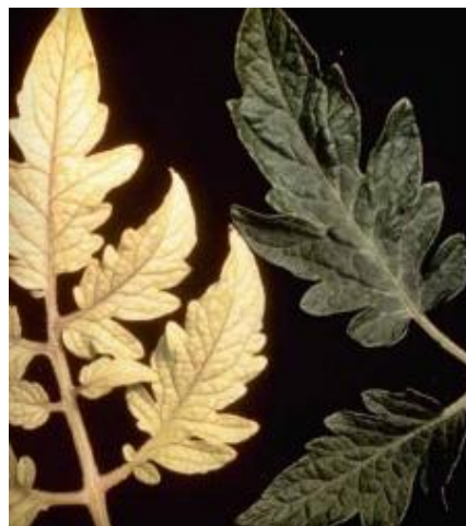
Slika 10 Kloroza i nekroza lista, izvori: Tomato Disease Field Guide, 2017.