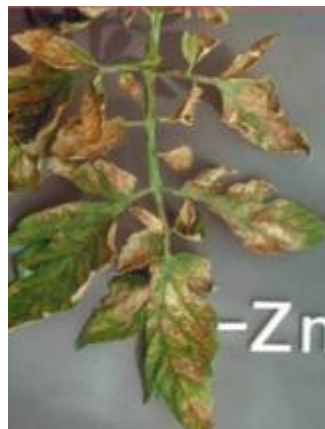
Slika 22 Nekroza lista, Glasilo biljne zaštite 5/2016

Kod nedostatka cinka na mlađem lišću se pojavljuju točkaste kloroze (žućenje) koje kasnije prelaze u pjegaste. U ozbiljnijim slučajevima klorotični dijelovi nekrotiziraju (slika 22). Žile lista nikada ne mijenjaju boju. Moguća su i uvrnuća peteljki lista. Višak cinka dovodi do brzog ugibanja biljke.