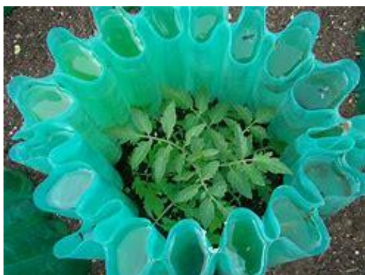
Slika 5 Wall of water

Prevenција i liječenje: paziti na dnevne i noćne temperature u zaštićenim prostorima. Ukoliko se uzgaja na otvorenom tempirati sadnju nakon zimskih mrazeva ili zaštititi biljku od mraza, a po velikim vrućinama zasjeniti ih. Dobra metoda za zaštitu biljke od naglih promjena temperature je Wall-of-Water kojom se koristi sustav plastičnih cijevi napunjenih vodom (slika 5). One preko dana apsorbiraju višak topline, a preko noći ju ispuštaju čime su dnevne i noćne temperature ujednačene. Na taj način se biljka može zaštititi od smrzavanja i do -8°C. U vodu iz cijevi je potrebno dodati izbjeljivač u omjeru 1/500 kako bi se spriječila pojava algi unutar cijevi. Još jedan način na koji se čuva toplina tla je malčiranje.