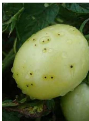
Slika 34 Lezije ploda, Glasnik zaštite bilja 3/2019