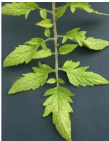
Slika 9 Kloroza lišća, izvori: Glasilo biljne zaštite, 5/2016

Manjak dušika uzrokuje blijedenje biljke (slika 9 i 10). Simptomi se prvo javljaju na starom lišću, a kasnije zahvaćaju mlađe. Lišće mijenja boju do svjetlozelene, a u težim slučajevima žute. Na peteljka i žilama se mogu pojaviti crvene nijanse. Kloroza je jednolična i reverzibilna. U ekstremnim slučajevima listovi postaju bijeli i dobivaju ljubičaste pjege, a nakon toga nekrotiziraju. Nekroza je ireverzibilna. Cijela biljka slabije raste, plodovi su mali i epiderma im je tanka. Višak dušika uzrokuje pretjerani rast biljke, stanjenje epiderme i tamnozelenu boju na biljci. Cijela biljka gubi čvrstoću i otpornost na ostale bolesti. Kontrola: Prije sadnje u tlo dodati organskog gnojiva koje dulje vremena otpušta dušik, najbolje stajnjak. Mineralna dušična gnojiva se lako ispiru iz tla pa je njih preporučljivo dodavati naknadno po potrebi, i to folijarnom gnojidbom.