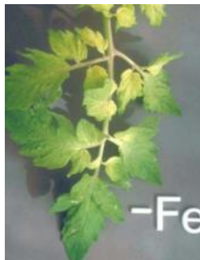
Slika 19 Početna kloroza lišća, Glasilo biljne zaštite 5/2016