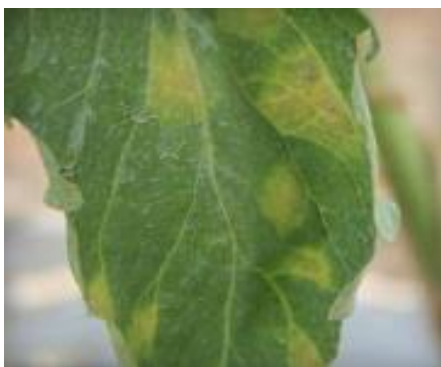
Slika 49 Klorotične pjege, Tomato Disease Field Guide, 2017.

sorte treba uzeti u obzir njenu otpornost na navedeni patogen, a ona se navodi kraticom „CF” koja potječe od starog imena gljve - Cladosporium fulvum . Također, postoji više tipova te gljive koji se međusobno fiziološki razlikuju, a određene sorte rajčice su otporne samo na neke od tih tipova. Biljne ostatke treba uništiti ili duboko zaorati. Nužan je plodored. U Hrvatskoj postoji samo jedan fungicid za suzbijanje baršunaste plijesni rajčice koji ima dozvolu za korištenje, međutim mogu se koristiti i određeni fungicidi za neka druga oboljenja za istu svrhu.