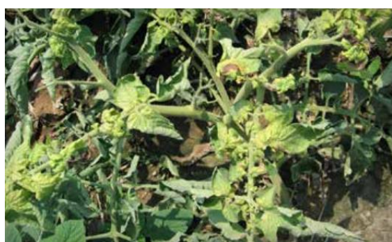
Slika 31 Simptomi na lišću, Tomato Disease Field Guide , 2017.

Virus mozaik krastavca (eng. Cucumber Mosaic Virus ili skraćeno CMV) je biljni patogen za kojeg se smatra da ima najveći broj potencijalnih domaćina među ostalim uzročnicima bolesti. Poznato je više od 1300 biljaka iz stotinjak porodica na kojima može parazitirati. Niti broj vektora mu nije malen jer ga prenosi sedamdesetak vrsta biljnih ušiju. Najčešće se javlja kod uzgoja rajčice na otvorenom. Simptomi na rajčici variraju ovisno o soju virusa i sorti rajčice, no uključuju mozaik i klorotične prstenovite na listovima (slika 31 i 32), svjetliju boju lisnih žila, stanjenje listi, stagniran rast biljke i nitavost stabljike. Na plodovima su to klorotične mrlje, prstenovi, mozaik i prosvjetljenja (Vončina, 2016.).