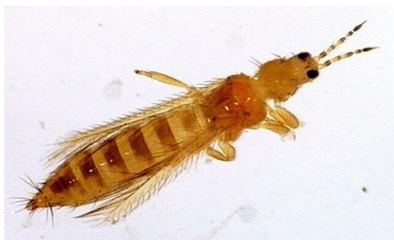
Slika 27 Kalifornijski trips

Virus pjegavosti i venuća rajčice (eng. Tomato Spotted Wilt Virus ili skraćeno TSWV) je trenutno najrašireniji i najštetniji virus koji napada rajčicu (Novak i sur., 2017.). Osim rajčice napada i papriku s kojom je u srodstvu, a ukupno vrši zaraze na preko 800 biljnih vrsta iz osamdesetak porodica. S obzirom na tako veliki broj vrsta koje joj mogu služiti kao domaćini, vrlo lako se širi, pa je tako svaki korov u blizini rajčice potencijalni nositelj virusa. Rajčice u zaštićenim prostorima su jednako ugrožene kao one na otvorenom zbog kalifornijskog tripsa. Kalifornijski trips, Frankliniella occidentalis je kukac koji se hrani biljnim sokovima i pritom služi kao vektor TSWV virusa (slika 27), a čest je nametnik u staklenicima i plastenicima. Smatra se da je upravo taj kukac odgovoran za naglo širenje TSWV virusa u Europi. Simptomi na rajčici (slika 28, 29 i 30) su smeđe pjege i brončane šare na listovima koji kasnije nekrotiziraju i venuće vrha stabljike. Na plodovima se javlja blijede boje i prstenaste mrlje.