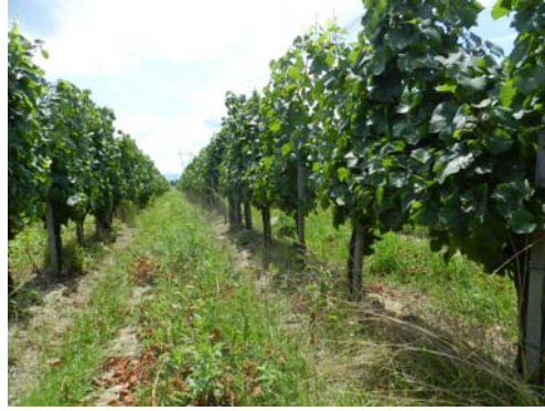
Slika 1. Vinograd OPG-a Romi Suk-Barić.