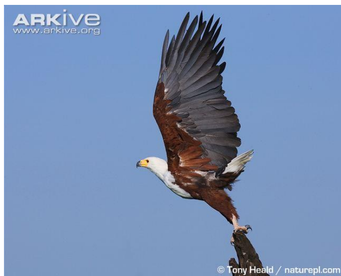
Slika 8. Madagaskarski orao ribar

Madagaskarski orao ribar (Slika 8) obitava u područjima madagaskarskih šuma. Endemska je vrsta Madagaskara gdje u malom broju živi na zapadnoj obali otoka. Dužina tijela je 60–66 cm, s rasponom krila 165–180 cm i mase 2,2–2,6 kg kod mužjaka i 2,8–3,5 kg za ženke.