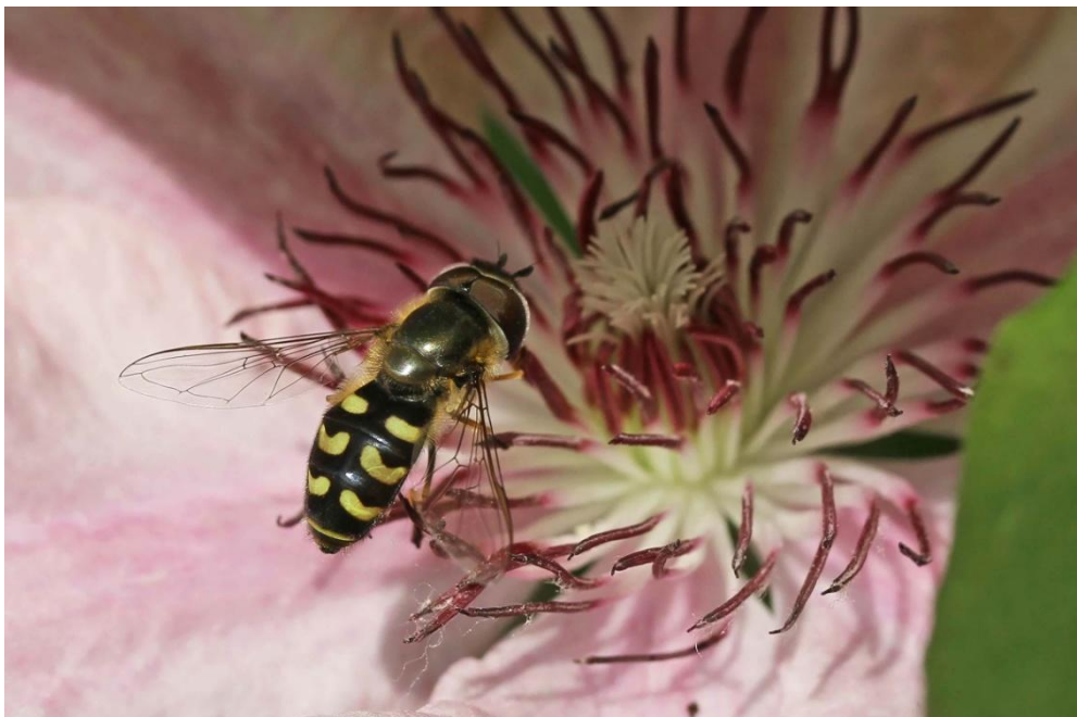
Slika 15. Eupeodes corollae