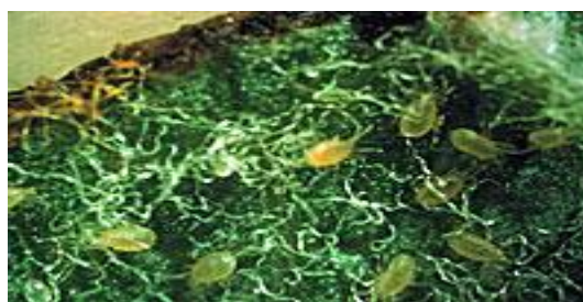
Slika 29. Kampimodromus aberrans