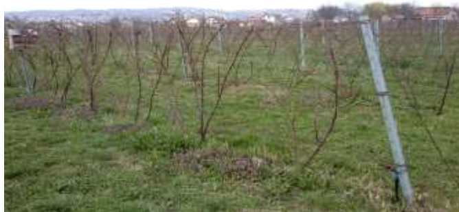
Slika 9. Kupinjak u Slavonskom Brodu

Hranjivom zastirkom nazivamo poluzreli kompost koji se na površini tla lagano raspada, te pri tome oslobađa hranjiva. Oba tipa malčiranja potpomažu stvaranje humusa i mrvičaste strukture ispod svoje površine, te sprječavaju isparavanje vlage iz tla. Na teškim tlima malčiranje je često jedini način da ovakva tla zadrže dobru strukturu i mogućnost obrade kroz duže vrijeme.