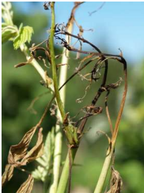
Slika br.8 Didymella applanata

http://plante-doktor.dk/hindbaerstaengelsyge.htm