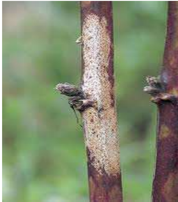
Slika br. 5 Septocytia ruborum na izdanku kupine

ZAŠTITA: Nove nasade treba podizati zdravim sadnim materijalom. Kod uočenih zaraza treba zaražene izboje odrezati i spaliti. (Cvjetković, 2010.).