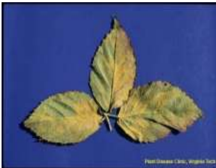
Slika br.4 Kuehneola uredinis na listu kupine

http://ppwsidlab.contentsrvr.net/details.pg_579.vesh