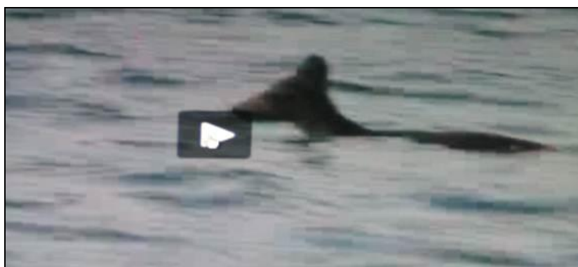
Slika 4: Srna u moru pliva s kopna na otok Krk