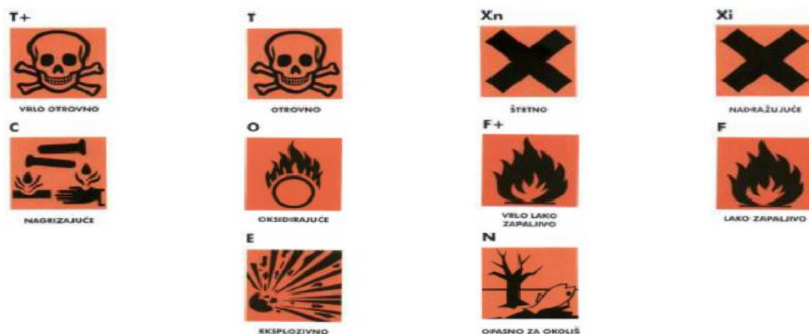
Slika 15. Oznake opasnosti na poljoprivrednim sredstvima

Kod korištenja moramo imati na umu karencu (najkraće razdoblje koje mora proći od uporabe sredstva do korištenja tretiranog proizvoda). Ona nam govori kada je neko sredstvo toliko razgrađeno da je sigurno koristiti prskane plodove ili biljke. Upute za karencu moraju se dobiti uz sredstvo. Za većinu sredstava je važna količina sredstva koje su potrebne da dođe do trovanja. To nazivamo toleranca. Toleranca je maksimalna dopuštena količina aktivne tvari nekoga sredstva za zaštitu u ili na namirnicama. Tolerance su zakonski propisane te se nadopunjuju kroz znanstvena istraživanja.