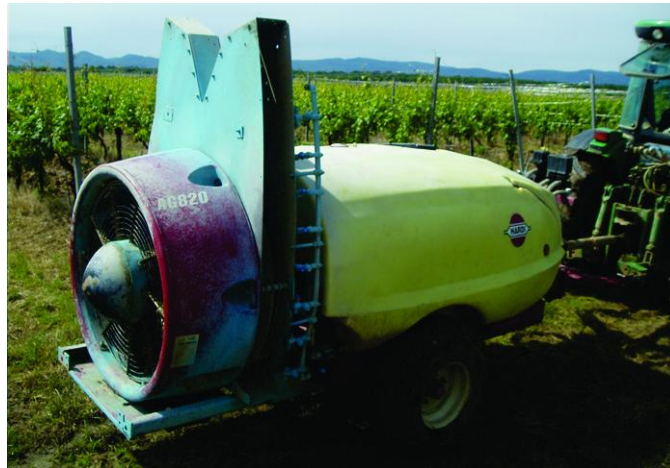
Slika 1. Raspršivač Hardi Z Saturn

Hardi klipno - membranska crpka je instalirana na raspršivaču, kapacitet je 140 l/min pri radnom tlaku od 20 bara. Model crpke koji je instaliran na raspršivaču je 363 i ima dvije membrane.