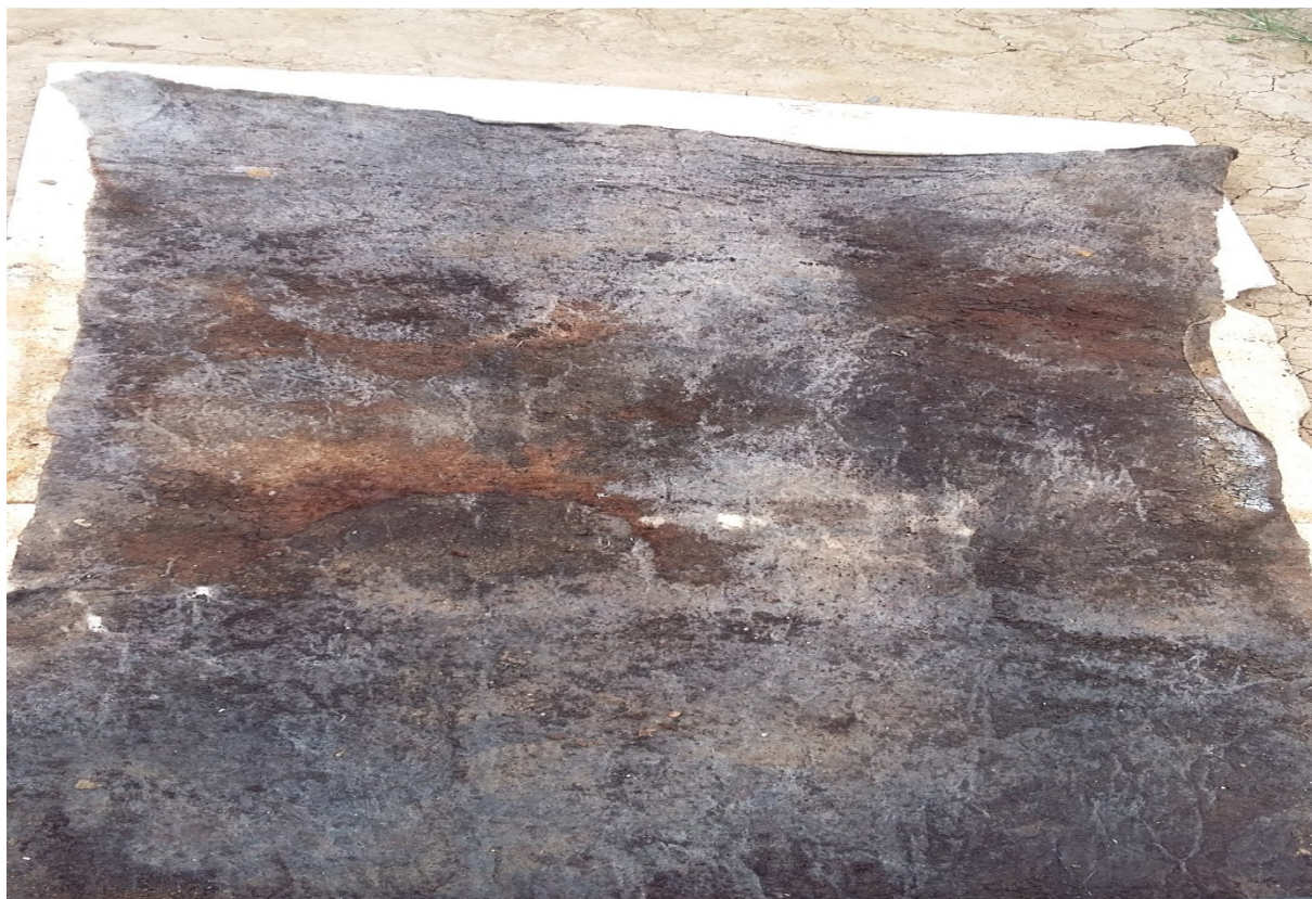
Slika 25. Postavljanje filca u red; foto Zečević B

Filc se postavljan na stiropor duž reda(slika 25), filc zadržava vlagu i štiti krizanteme u loncima od isušivanja i sprječava prodiranje korijena na stiropor.