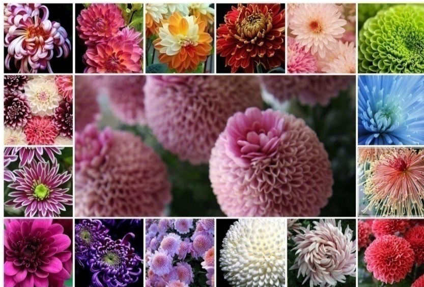
Slika 2. Podjela krizantema