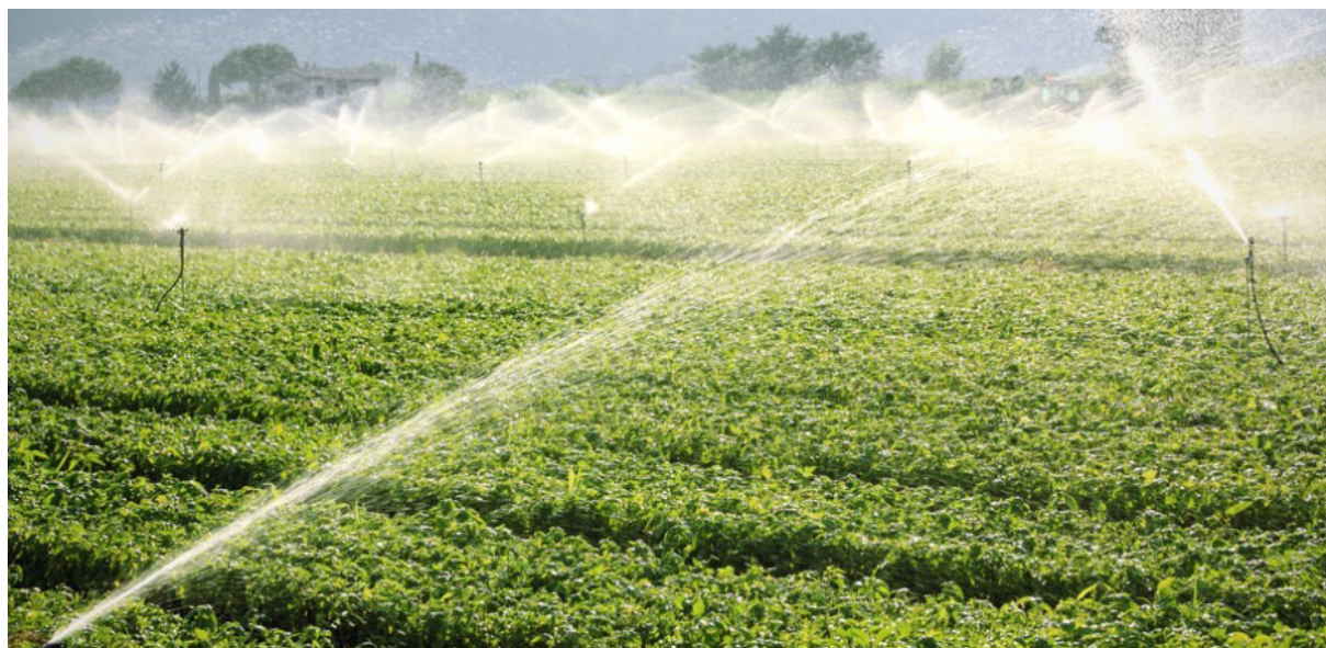
Slika 10. Navodnjavanje poljoprivrednih kultura

U Hrvatskoj se navodnjava 9.264 hektara što čini 0.86% naših obradivih površina i što je jako malo u odnosu na naša prirodna bogatstva rijeka i jezera. Svrha navodnjavanja kao melioracijske mjere je nadoknaditi nedostatak vode koji se javlja pri uzgoju poljoprivrednih kultura kako bi se osigurao sto veći biološki potencijal. Širom svijeta navodnjavaju se poljoprivredne površine u svim klimatskim područjima. Ono je danas postalo univerzalna melioracijska mjera i simbol razvijenoga društva.