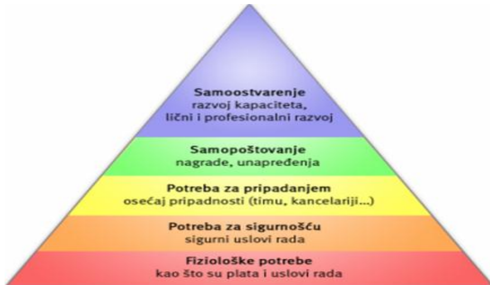
Slika 4. Maslowljeva piramida ljudskih potreba [26]