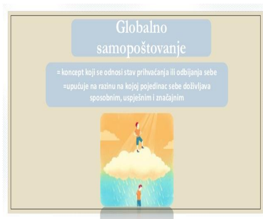
Slika 2. Globalno samopoštovanje [24]