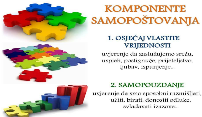
Slika 1. Komponente samopoštovanja [23]

Odgoj predstavlja važnu kariku u razvoju samopoštovanja. Odgoj djeteta započinje u obitelji. Uloga roditelja je od izuzetne važnosti. Roditelji bi trebali biti osobe koje cijene i poštuju sebe po mišljenju navedenom u [7].