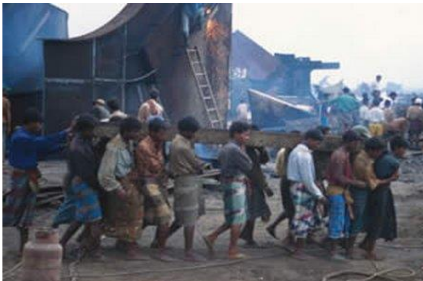
Slika 5. Neadekvatno opremljeni radnici u procesu recikliranja broda u Bangladešu [18]

Radnici koji rade u nerazvijenim zemljama su iznimno siromašni, te su svakoga dana podvrgnuti smrtnim opasnostima, a broj smrti u takvim uvjetima na brodu koji se rastavlja raste unatoč svim mjerama opreza.