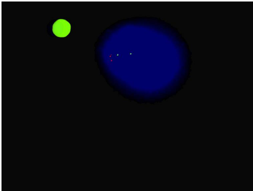
Slika 1. Komet-FISH na limfocitima periferne krvi. Slika predstavlja neoštećeni nukleoid u kojem su svi signali unutar glave kometa, crveni signal predstavlja gen TP53, dok zeleni centromeru kromosoma 17

U tablicama 2-7 su prikazani rezultati dobiveni komet-FISH (2-4 broj uočenih delecija, 5-7 broj uočenih migracija u rep kometa) testom na stanicama limfocita izloženih u ekvivalentima koncentracija od ADI (dopušteni dnevni unos), REL (razina izloženosti stanovništva) , OEL (razina izloženosti radnika) i 3 µg/ml insekticida klorpirifos, alfa ciprotrina i imidakloprida. U tablicama 8-13 su prikazani rezultati dobiveni komet testom (dužina repa tabl 7-9 i intenzitet repa tablice 10-12) pri istim uvjetima izloženosti insekticidima. Kod niti jednog primjenjenog insekticida nije primjećeno značajno povećanje promatranih parametara (niti kod kometa, niti kod komet-FISHa) u usporedbi s negativnom kontrolom.