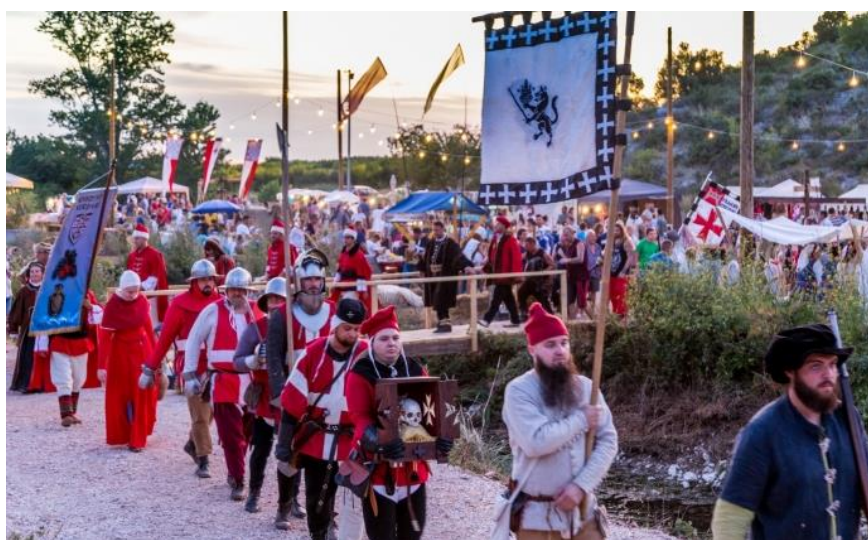
Sl. 5. Primjer kulturne manifestacije u Južnom hrvatskom primorju – Dani Vitezova vranskih u Vrani

Etnozanimljivosti koje nudi zadarska regija su Manastir Krupa kod izvora rijeke Krupe u okolici Obrovca, Kula Jankovića obitelji Desnica u Islamu Grčkom, Ranč magaraca Dar-mar kod Nina, Priča o paškom siru – kušaonica sira sirane Gligora te Etnografska zbirka Kolan na Pagu i ostale (HGK, 2015). Na području zadarske regije se prema nacionalnom katalogu Ruralni turizam Hrvatske (2015) nalazi 7 objekata seoskog turizma, od čega je 5 objekata sa smještajnim kapacitetom. Svaki od njih obiluje raznolikim sadržajem, a po najvećem broju se izdvaja Seosko gospodarstvo Mićanovi dvori u okolici Obrovca. Mićanovi dvori pored smještaja i prehrane u svojoj ponudi sadrže poljoprivredne aktivnosti na gospodarstvu, lov, ribolov, pješčenje/trekking i planinarenje, promatranje ptica, vožnju terenskim vozilima, vožnju plovilima, boćanje, kupanje u bazenu, korištenje sportskih terena i ostalo (HGK, 2015).