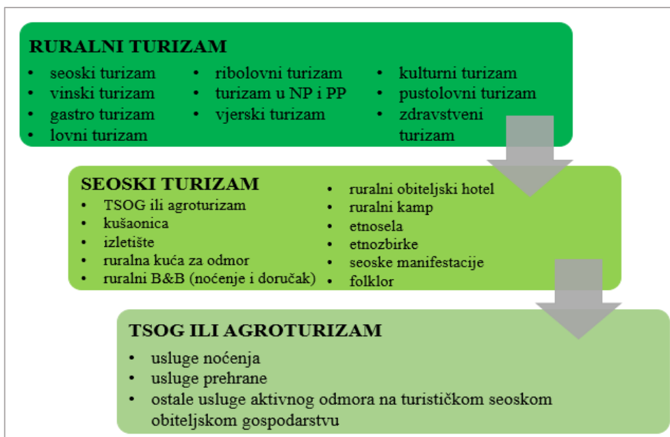
Sl. 1. Shematski prikaz međuočnosa ruralnog, seoskog i agroturizma