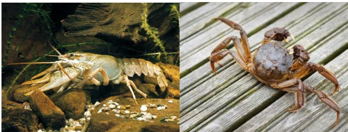
Slika 5. A) Autohtoni dekapodni rak s područja Kopačkog rita i rijeke Dunav ( Astacus leptodactylus ), B) Invazivna vrsta kineske rakovice ( Eriocheir sinensis )