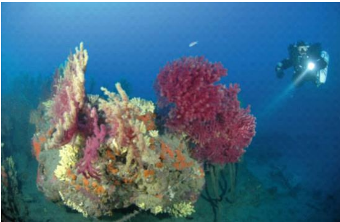
Slika 5. Mediteranska crvena gorgonija ( Paramuricea calvata ). (Photo:Informare).

Konzumacija i zapletanje u morski otpad ima izrazito značajan utjecaj na život u moru. Točnije zooplanktonskom konzumacijom mikroplastike čestice plastike ulaze u morski hranidbeni lanac. Zooplanktivori (ribe mezopelagijala, kitovi usani) su izloženi direktnom unošenju mikroplastike putem kontaminiranog zooplanktona ili slučajnom unošenju tokom hranjenja. Pošto mikroplastika sadrži toksične spojeve koji se akumuliraju tokom hranidbenog lanca to ima izrazit ekotoksikološki učinak na sve karike u lancu prehrane, uključujući i čovjeka. Slučajno zapletanje u morski otpad je identificirano kao najveća prijetnja opstanku najugroženije vrste tuljana na svijetu Sredozemne medvjedice ( Monachus monachus ). (Karamandilis i sur., 2008.). Više od polovice zabilježenog otpada na morskom dnu čini odbačena ili izgubljena ribarska oprema, koja direktno utječe na morske bentoske organizme, primarno gorgonije kao i spužve. Posljedično morski otpad u Mediteranu ima dalekosežne posljedice na bioraznolikost i ekosustav Sredozemnog mora.